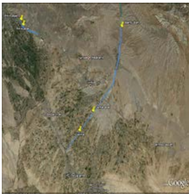
تصویر ۱ - نقشه موقعیت ایستگاه های مطالعاتی.

ایستگاه امین آباد نیز در کانال آب کشاورزی واقع شده است. این کانال بتونی، از تقاطع کانال حاجی آباد و کانال امین آباد حاصل شده که با انشعابی از فاضلاب