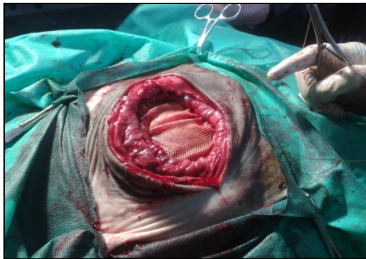
شکل ۲ - ترمیم فتق ضربه ای توسط توری جراحی پلی پروپیلن

موارد ۳ الی ۱۱ مادیان های شش الی یازده ساله ای بودند که به صورت تجربی نقیصه ای به ابعاد ۴ × ۸ سانتی‌متر در محل خط وسط شکم آنها ایجاد شده، پرده صفاق نیز باز شده و توسط توری جراحی پلی پروپیلن ترمیم یافته بودند. در ضمن موارد ۱۲ الی ۲۰ مادیان های پنج الی نه ساله ای بودند که با شیوه ذکر شده در بالا در همان طرح تحقیقاتی دچار نقیصه شده و توسط توری جراحی سپرامش ترمیم یافته بودند. داروهای قبل از جراحی در این گروه از اسب‌ها شامل آنتی بیوتیک و ضد التهاب پیشگیرانه (پنی سیلین پروکائین جی ۵ میلیون واحد بین المللی و فنیل بوتازون ۲۰٪ با همان مقادیر گفته شده در بالا) بودند. دیازپام (با میزان ۰.۲ میلی‌گرم به ازاء هر کیلو گرم وزن بدن) به عنوان آرامبخشی در مرحله پیش از بیهوشی به صورت داخل