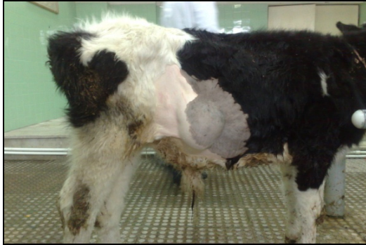
شکل ۱ - نمونه ای از فتق ضربه‌ای یا شکمی

درد بعد از عمل نیز داروی فنیل بوتازون ۲۰٪ (با میزان ۵ میلی‌گرم به ازاء هر کیلو گرم وزن بدن) تا ۳ روز تزریق شد (اشکال شماره ۱ و ۲).