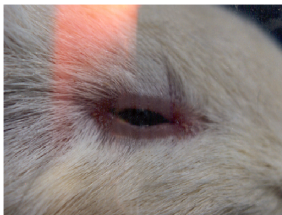
شکل شماره ۲- جمع شدگی زجاجیه و خونریزی زجاجیه و کدورت قرنیه در خوکچه هندی

در روزهای بعدی خونریزی های بیشتری در شبکیه و زجاجیه رخ داد و پاسخ حیوان به نور و محرکهای فیزیکی معمول تقلیل یافت. تورم دیسک اپتیک، کدورت قرنیه و کاتاراکت و کوری متعاقباً پدیدار گردید. شکل شماره ۲ جمع شدگی زجاجیه و خونریزی زجاجیه و کدورت قرنیه در خوکچه هندی را نشان می دهد.