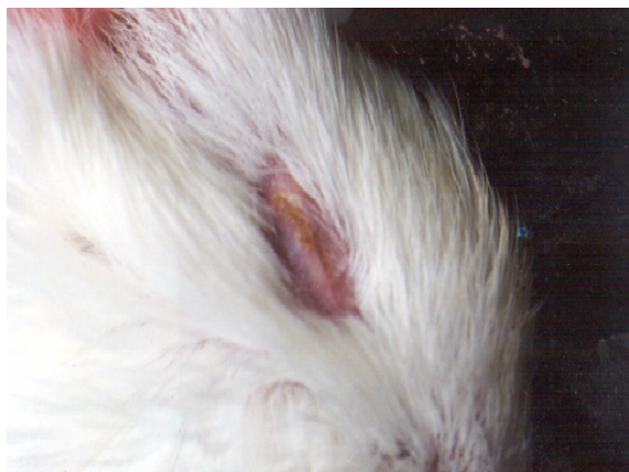
شکل شماره ۳- نشانه چشمی پایانی مسمومیت با نمک هیپوتونی چشم در خوکچه هندی (PHTHISIS BULBI)

طیف وسیع نشانه های چشمی هیپرناترمی بیشتر در گروهی از رتها که از غلظت ۲٪ کلرور سدیم استفاده می نمودند و قدرت تحمل هیپرناترمی را داشتند نمایان گشت. در میان سه گونه جانوری خوکچه هندی بیشترین حساسیت به هیپرناترمی را داشت و میزان تلفات ناشی از استفاده از غلظت های مختلف کلرور سدیم در خوکچه هندی بیشتر از دو گونه جانوری دیگر بود، رت حساسیت متوسطی داشت و خرگوش نسبت به دو گونه جانوری دیگر حساسیت کمتری را دارا بود.