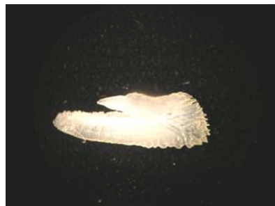
شاخص اندازه اتولیت: ۰/۰۲ شاخص کشیدگی: ۲/۷ شاخص ضخامت: ۰/۱

مشخصات ریخت‌شناسی اتولیت ماهی قباد Scomberomorus guttatus این ماهی دارای اتولیت‌های بسیار کوچک، ظریف و نازک است. در سطح پروکسیمال دارای تحدب ناچیز و در سطح دیستال اندکی مقعر است. روستروم تیز و کشیده، آنتی‌روستروم تیز و برآمده و پست‌روستروم مشخص و نسبتاً کند است (تیز نیست). فاصله روستروم