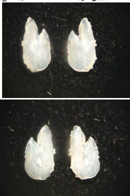
شکل ۱- مقایسه سطح پروکسیمال (خاوی شیار سولکوس) و دیستال در اتولیت: سمت چپ سطح پروکسیمال، سمت راست سطح دیستال

به ترتیب ۸، ۵، ۴، ۳۰، ۱۱، ۱۰ و ابزار صید ماهیان در این بررسی، تور پیاله‌ای و گوشگیر سطح بود. مشخصات زیست‌سنجی هر نمونه شامل وزن، طول کل، طول استاندارد و طول چنگالی اندازه‌گیری و ثبت گردید. استخراج اتولیت‌ها از سطح شکمی ماهی و به روش میان‌آبشی انجام گرفت (۸). پس از استخراج اتولیت‌ها با اتانول ۷۰٪ تمیز شده و پس از خشک شدن در ظروف شیشه‌ای کوچک نگهداری شدند. شکل اتولیت‌ها به کمک استریومیکروسکوپ بررسی گردید. بیومتری اتولیت‌های بزرگ (با طول بزرگتر از ۵ میلی‌متر) به کمک کولیس و با دقت ۰/۱ میلی‌متر انجام شد. بیومتری اتولیت‌های کوچکتر نظیر اتولیت ساردین ماهیان و موتو ماهیان با کمک استریومیکروسکوپ و لنز چشمی مدرج با دقت ۰/۰۱ میلی‌متر انجام گردید. توزین اتولیت‌ها با استفاده از ترازوی دیجیتال با دقت ۰/۰۰۱ گرم و برای اتولیت‌های بسیار ریز با ترازوهای دیجیتالی با دقت ۰/۰۰۱ و ۰/۰۰۰۰۱ گرم انجام گرفت (۲). برای عکسبرداری اتولیت‌ها از استریومیکروسکوپ و دوربین دیجیتالی استفاده شد. تصاویر هم از سطح پروکسیمال و هم از سطح دیستال تهیه شدند. قدرت تفکیک دستگاه دوربین مورد استفاده، ۵ مگا پیکسل بود.