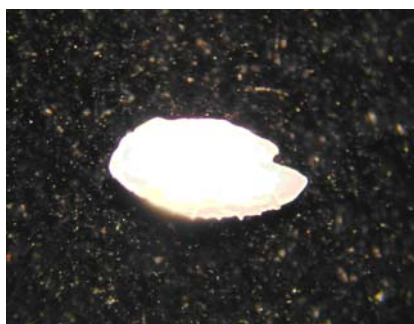
شکل ۵- تصویر اتولیت سمت چپ موتو منقوط

اتولیت کوچک اما نسبتاً ضخیم است. اتولیت در سطح پروکسیمال دارای تحدب ناچیز و در سطح