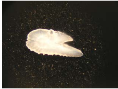
شاخص اندازه اتولیت: ۰/۰۲۱ شاخص کشیدگی: ۲/۲ شاخص ضخامت: ۰/۱۹