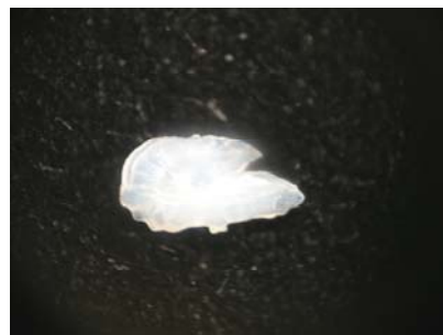
شاخص اندازه اتولیت: ۰/۰۲۵ شاخص کشیدگی: ۱/۸ شاخص ضخامت: ۰/۲۷

مشخصات ریخت‌شناسی اتولیت ساردین رنگین‌کمان Dussumeria acuta اندازه اتولیت کوچک با ضخامت متوسط می‌باشد. اتولیت در سطح پروکسیمال دارای تحدب ناچیز و در سطح دیستال مسطح است. روستروم کشیده و نسبتاً تیز،