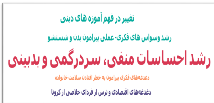
نمودار مضامین ۲ مضامین شکل‌گیری رفتارهای جمعی نمایشی در بستر تجربه زیسته مردم از ویروس کرونا

در نمودار مضامین شکل‌گیری رفتارهای جمعی نمایشی در بستر تجربه زیسته مردم از ویروس کرونا، همان‌طور که ملاحظه می‌شود پررنگ‌ترین مفهوم حائز بیشترین تکرارپذیری و اهمیت است. به ترتیب پررنگ بودن؛ مفاهیم رشد احساسات منفی، سردرگمی و بدبینی، رشد وسواس‌های فکری- عملی پیرامون بدن و شستشو، تغییر در فهم آموزه‌های دینی، دغدغه‌های فکری پیرامون به خطر افتادن سلامت خانواده و دغدغه‌های اقتصادی و ترس از فردای خلاصی از کرونا بیشترین فراوانی و اهمیت را دارند.