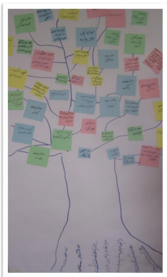
تصویر شماره‌ی ۳: درخت مشکلات محله‌ی کوهسار

بنا به گفته‌ی یکی از اعضای شورایاری در زمینی که سابقاً باغ انار بود شهرداری منطقه تصمیم به تاسیس سوله‌ی بازیافت گرفت. پس از مخالفت اهالی و شورایاری این تصمیم به ایجاد میدان میوه و تره بار تغییر کرد؛ اما در نهایت سوله‌ی بازیافت در کنار این محله ایجاد و مشکلی به مشکلات محله اضافه شد. همچنین سامان‌سرایي برای اسکان دختران فراری در زمین‌های مفید محله تأسیس شده است؛ فضاهایی که به گمان آنان می‌تواند برای حل بسیاری از مشکلات محله از جمله ساخت اماکن فرهنگی و آموزشی مفید