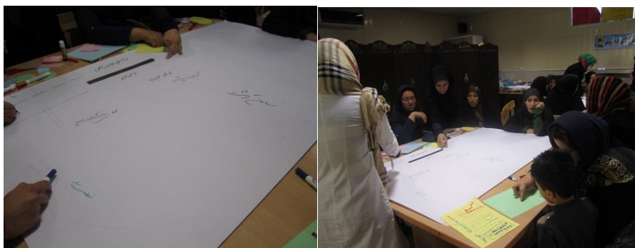
تصویر شماره‌ی ۲: ترسیم نقشه توسط اهالی

سیاست‌گذاری‌های انجام شده به فعالیت‌های شورایی مربوط است. اجرای دو تکنیک بوته‌اثربخشی و سوات نشان داد که اقدامات شورایی در راستای ارتقای حس تعلق به محله نبوده بلکه از جاکندگی ساکنان محله را فزونی بخشیده است.