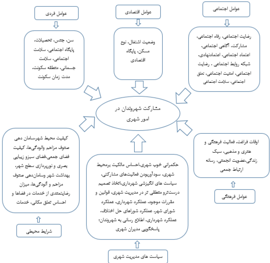
شکل شماره ۲: نمودار مشارکت شهروندان