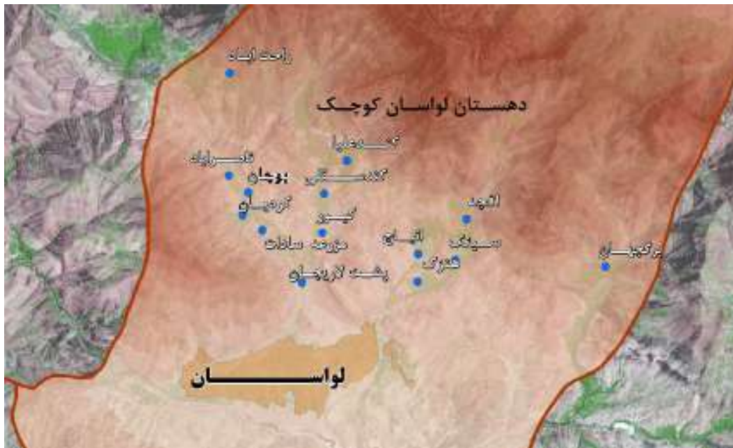
تصویر ۲: موقعیت جغرافیایی روستاهای افجه، برگ جهان و کند علیا

کند علیا: این روستا در فاصله ۶ کیلومتری از شهر لواسان مرکز بخش لواسانات قرار دارد.