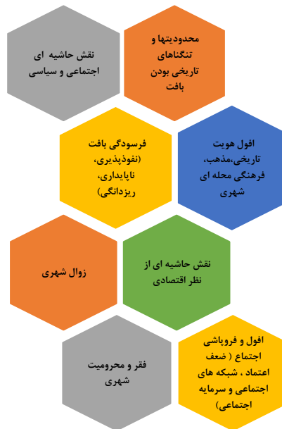
شکل ۱: مسائل اساسی محله امامزاده یحیی

به منظور تجزیه و تحلیل اطلاعات و داده‌ها در بخش کمی، از دو روش آمار توصیفی و آمار استنباطی استفاده شده است. از آمار توصیفی به منظور تعیین فراوانی‌های ویژگی‌های جمعیت شناختی و فراوانی‌های پاسخ‌های داده شده به هر یک از گویه‌ها استفاده شد. در بخش آمار توصیفی از جداول توزیع فراوانی و درصد، میانگین به عنوان شاخص گرایش مرکزی و از انحراف معیار و واریانس به عنوان شاخص‌های پراکندگی استفاده گردید. در سطح آمار استنباطی، به منظور تحلیل داده‌های حاصل از پرسشنامه تعیین وضعیت فرهنگی و اجتماعی محله امامزاده یحیی واقع در منطقه ۱۲ شهرداری تهران، (مبنی بر تعیین نقاط قوت و ضعف، فرصت‌ها و تهدیدها)،