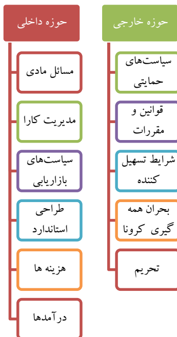
شکل ۱. ابعاد بحران مالی در صنعت هتلداری در شرایط بحرانی کووید-۱۹ طبق نظر خبرگان

طبق جدول های ۲ و ۳، یازده بعد به عنوان ابعاد کنترل بحران مالی به دست آمد. ۶ بعد به عنوان ابعاد داخلی اثرگذار و ۵ بعد به عنوان ابعاد خارجی اثرگذار مشخص شدند که در شکل ۱ مشخص شده اند.