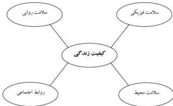
نمودار ۱- ابعاد تشکیل دهنده کیفیت زندگی از نظر سازمان جهانی بهداشت (نجات، ۱۳۸۵)