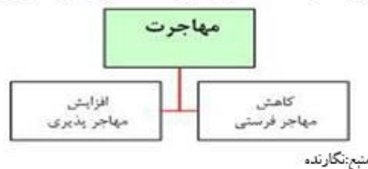
شکل شماره ۳): شاخصهای مورد مطالعه در مهاجرت در این تحقیق

این مسئله موقعی مشکل ساز می شود که مهاجر فرستی و مهاجر پذیری بدون برنامه و بی رویه باشد و باعث خالی شدن جمعیت یک نقطه و افزایش بی رویه جمعیت نقطه دیگر شود که این امر مشکلات خاص خود را از لحاظ اقتصادی و اجتماعی در بر خواهد داشت. در هر برنامه ای که برای مناطق علی الخصوص نقاط روستایی تدوین و اجرا می شود مسئله مهاجرت باید به طور خاصتر مورد توجه قرار گیرد تا باعث مهاجر فرستی و مهاجر پذیری بی رویه نگردد.