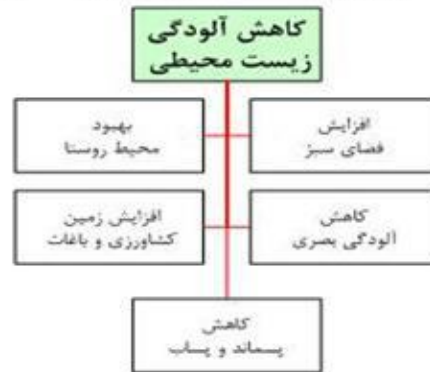
شکل شماره ۴: شاخصهای مورد مطالعه در کاهش آلودگی زیست محیطی در این تحقیق