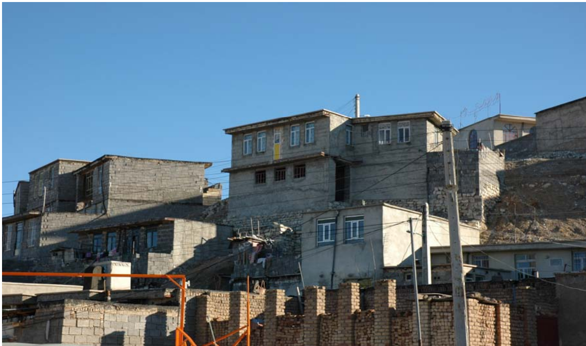
تصویر شماره ۲: ساخت و سازهای غیراصولی