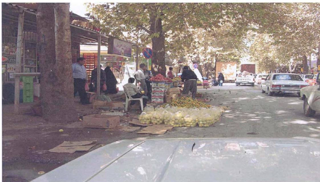
تصویر شماره ۴: ورود سد معبر به وسط خیابان

سرانه تولید زباله در مناطق مختلف شهر ایلام با توجه خصوصیات فرهنگی، اجتماعی و حتی کارکرد شهرداری یکسان و یکنواخت نیست. بدین ترتیب که در مناطقی مانند سبزی آباد علی رغم وضعیت اقتصادی پایین میزان سرانه تولید زباله زیاد است، که علت این امر دفع فضولات دامی نگهداری شده توسط اهالی، همراه زباله های شهری است. مطالعات انجام شده نشان دهنده این است که حدود ۲۸/۸ درصد خانوارهای مورد مطالعه در محل سکونت خود از دام نگهداری می کنند که حدود ۵/۳ درصد آنها فضولات ناشی از نگهداری دام را همراه زباله های شهری و خانگی، ۶ درصد از طریق سوزاندن، ۱/۲ درصد از طریق دفع در کانال های روباز منطقه و ۴ درصد از طریق تخلیه در زمین های خالی و دور از محل سکونت و ۹/۴ درصد از طریق تحویل ماشین های شهرداری دفع کرده و سایر خانوارها هیچ گونه اظهار نظری در این خصوص ننموده اند. لذا با توجه به اطلاعات به دست آمده حدود ۱۴/۷ فضولات ناشی از محل های نگهداری دام به همراه زباله های شهری دفع می گردد. سرانه تولید در روز حدود ۱/۳ کیلوگرم برآورد شده است که تقریباً سه برابر سرانه تولید کشور و حدود ۶ برابر سرانه تولید زباله در کشورهای اروپایی است (محیط زیست استان ایلام - ۱۳۸۴ - ص ۳۸۲).