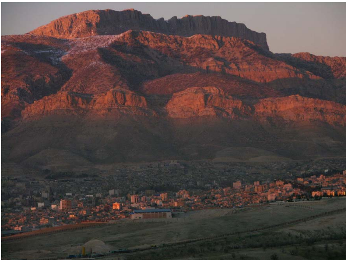
تصویر شماره ۱: نمای شمالی شهر ایلام ( محدود به ارتفاعات) و محدودیت رشد شهر