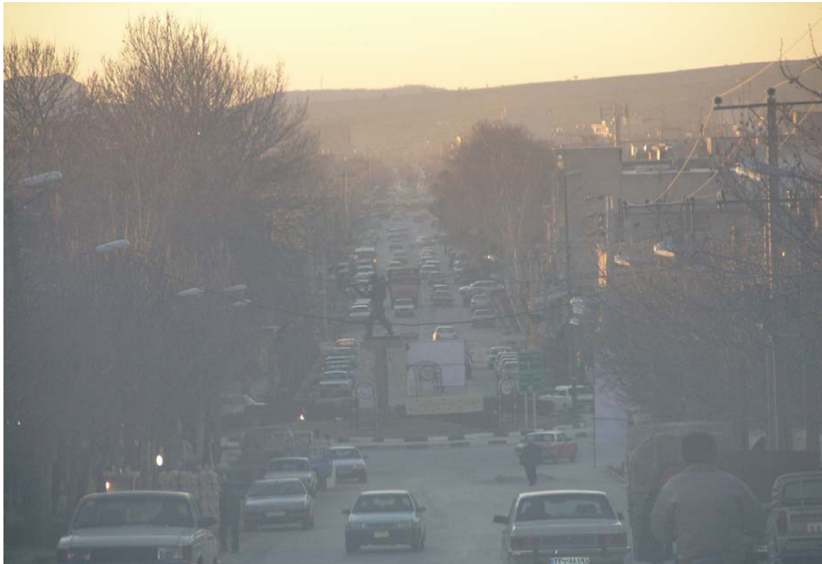
تصویر شماره ۳: آلودگی ناشی از ذرات معلق در اوائل صبح

در سال های گذشته حدود ۴۰ قطعه باغ با مساحت تقریبی ۴۰ هکتار در شهر ایلام وجود داشته که متأسفانه بیشتر این باغ ها نابوده شده است ضمن اینکه قنوات قدیمی که وجود داشته که حدود ۱۴ رشته قنات بوده که امروزه فقط یک رشته آن در شهر ایلام مورد استفاده قرار دارد. در حال حاضر در شهر ایلام چهار پارک فعال وجود دارد و تعداد ۲۱ بوستان محله ای استفاده واقع شده است.