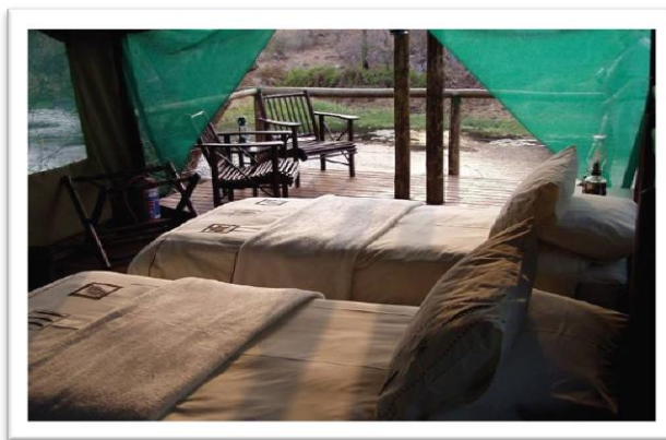
تصویر ۵: نمایی از اقامتگاه بوم گردی در اولانی اکوتوریسم پارک

این پارک طبیعت گردی از دو بخش - زون - مجزا تشکیل شده است؛ بخش پراکنده و بخش متمرکز. بخش پراکنده این پارک را عرصه های طبیعی بکر تشکیل داده است که حیات وحش در آن آزادانه زندگی می کنند و بخش متمرکز با برپایی اقامتگاه بومی، رستوران و سرویس بهداشتی نیاز اولیه گردشگران را فراهم می آورند . در طراحی این پارک تلاش شده است تا زون متمرکز با فاصله ای متناسب از عرصه طبیعی، علاوه بر حفظ چشم انداز و بوم منطقه، خود به محلی برای تماشای سایر جاذبه های طبیعی موجود همانند تماشای غروب خورشید، آب خوردن حیات وحش، پرواز پرندگان و ... تبدیل شود .