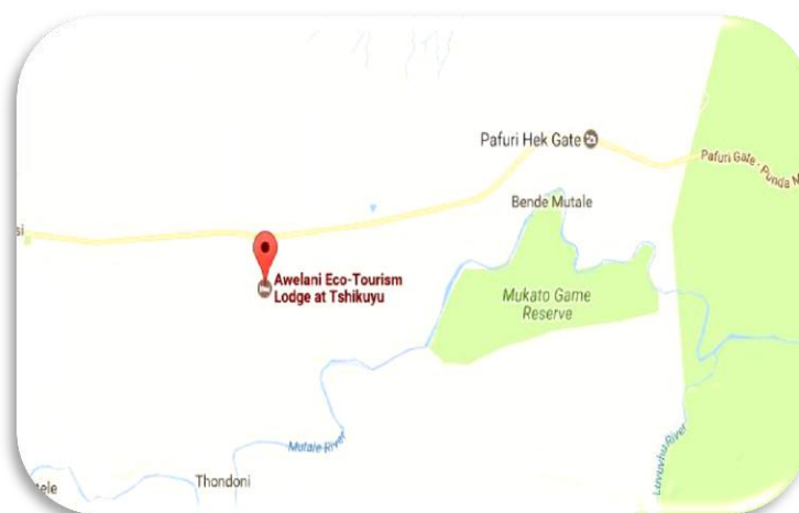
تصویر شماره ۳: موقعیت جغرافیایی آولانی اکوتوریسم پارک

منطقه مورد مطالعه پارک طبیعت گردی «آولانی اکوتوریسم پارک» در منطقه «تیشیکویا» ۱ آفریقای جنوبی واقع شده است؛ جایی که از سال ۲۰۱۰ میلادی به بعد همواره گردشگرپذیرترین بخش آفریقا بوده است و با جذب ۱۰/۳ میلیون گردشگر در سال ۲۰۱۴ میلادی بزرگترین مقصد گردشگری این کشور - به ویژه در زمینه اکوتوریسم - بوده است. خلاقیت در ارائه ظرفیت‌های گردشگری آن، یکی از مهم‌ترین روش‌ها برای دستیابی به این موفقیت بوده است که ایجاد پارک طبیعت گردی - اکوتوریسم پارک - نمونه‌ای از آن به شمار می‌آید.