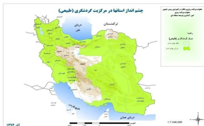
تصویر شماره ۶: نقشه چشم اندازهای طبیعی استان های ایران