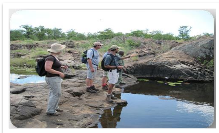
تصویر شماره ۴: نمایی از برگزاری اکوتوریسم تور در محل آولانی اکوتوریسم پارک