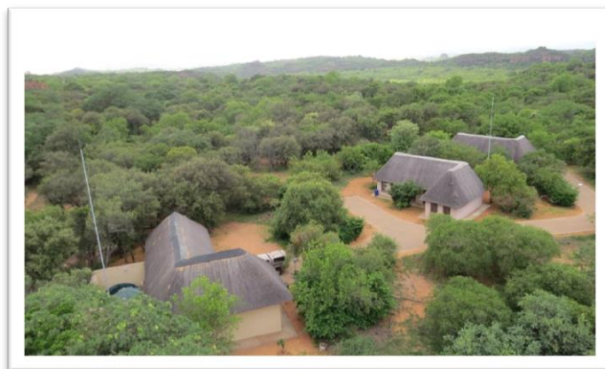
تصویر شماره ۲: نمایی از اولانی اکوتوریسم پارک