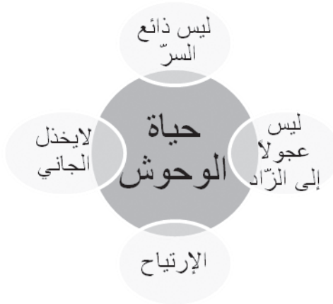
الرسم الثاني: حياة الوحوش

وَإِنِّي كَفَانِي فَقَدْ مَنْ لَيْسَ جَازِيًا جُحْسَنِي وَلَا فِي قُرْبِهِ مُتَعَلِّلُ ثَلَاثَةٌ أَصْحَابٍ: فُوَادٌ مُشِيعٌ وَأَبْيَضٌ إِصْلِيْتُ وَصَفْرَاءُ عَيْطَلُ