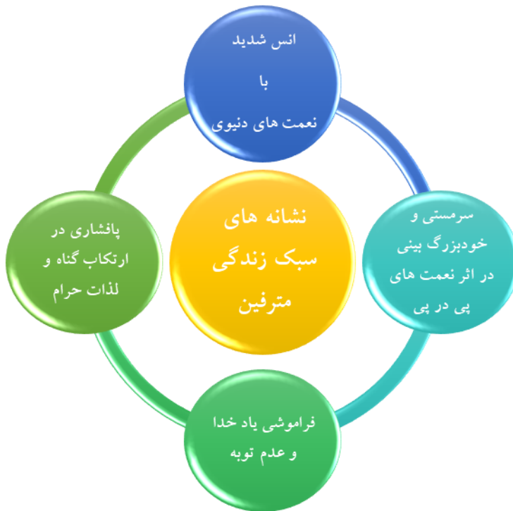
نمودار ۱. نشانه های سبک زندگی مترفین

به هر روی، در زندگی مترفین، نسبت و پیوند معناداری میان «افزایش گناهان» و «فراموشی یاد خدا و عدم توبه» از یک سو و «انس با نعمت های دنیوی» و «سرمستی و خودبزرگ بینی در اثر نعمت های پی در پی» از سوی دیگر وجود دارد. زیرا پافشاری در ارتکاب گناه در کنار افزایش نعمت های الهی، باعث فریب خوردن مترفین شده و آنان به غلط، گمان می کنند این بهره‌مندی، نشان‌دهنده خشنودی خداست. این اشتباه راهبردی باعث می شود که آنان دلیلی برای طلب آموزش از خداوند بابت ارتکاب گناهان خود نبینند و طبعاً این سبک زندگی نادرست را تغییر هم نمی دهند. بنابراین، وجه ناگوار سنت استدرج برای مترفین، سرگرم شدن به دنیا و زرق و برق آن است. این همان نکته ای است که ایشان از آن غافلند و باعث سقوط تدریجی و فرجامی تلخ در دنیا برای این گروه می شود.