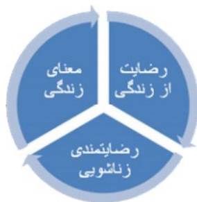
شکل ۱-۲. ارتباط معنای زندگی، رضایت از زندگی و رضایتمندی زناشویی

زمانی که زوجین ازدواج می‌کنند، هر دو احساسی کلی از رضایت از زندگی را با خود به زندگی مشترک می‌برند که گرچه اغلب مورد توجه نیست؛ ولی برای ازدواج مفید است و به عنوان عاملی محافظت‌کننده، در سازگاری زناشویی آینده، مؤثر است. به علاوه، وقتی گام‌هایی را جهت بهبود زندگی مشترک و ارتقاء رضایت زناشویی بر می‌دارند، اثر آن منجر به افزایش احساس کلی رضایت از زندگی می‌شود. بر همین اساس، زمانی که زوجین به شیوه‌های مؤثر جهت بهبود ازدواج خود تلاش می‌کنند؛ به عنوان مثال، به طور تخصصی به جست‌وجوی کمک می‌روند، در کلاس‌های آموزش غنی‌سازی روابط شرکت می‌کنند، سرمایه‌گذاری‌های مشترک پایه‌ریزی می‌کنند و از روی آگاهی در جهت افزایش صمیمیت، مهربانی، بخشش تلاش می‌کنند، رضایت از زندگی آن‌ها هم افزایش می‌یابد (استنلی و گیبسون، ۲۰۱۲: ۴۵).