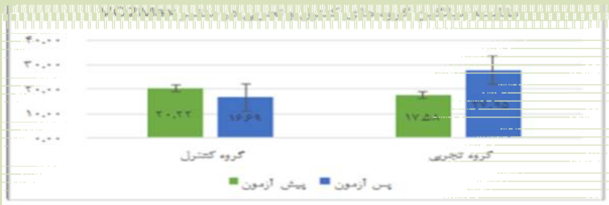
نمودار 1- مقایسه میانگین گروه های کنترل و تجربی در متغیر توان هوازی VO_2 Max (میلی لیتر در کیلوگرم در دقیقه)