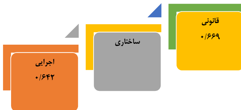
شکل ۳. نمودار ترسیمی برای متغیر وابسته ساختاری

در مرحله آخر متغیر قانونی را به صورت متغیر وابسته و متغیر کارکردی به عنوان متغیر مستقل در نظر گرفته می‌شوند. جدول ۱۱ ضرایب بتا را که بیا استفاده از روش رگرسیون به شیوه Enter محاسبه شده را نشان می‌دهد.