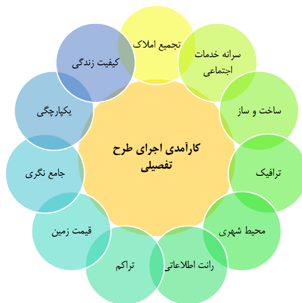
شکل ۱- کارآمدی اجرای طرح تفصیلی با تاکید بر زیست‌پذیری

(Liu, Nijkamp et al. 2017)، (Sofeska 2017)، (Zhan, Kwan et al. 2018)، (Badland, Whitzman et al. 2014)