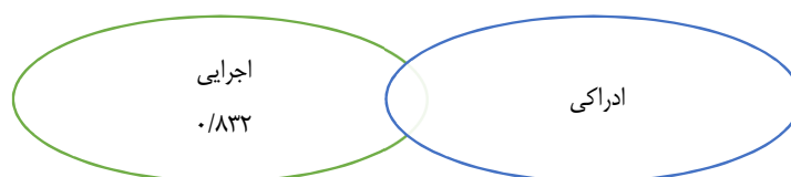
شکل ۴- نمودار ترسیمی برای متغیر وابسته اجرایی

بر اساس جدول خروجی ۱۱ عامل اجرایی مربوط کننده با بتای ۰/۸۳۲ بیشترین تأثیر را در متغیر قانونی دارد. بر اساس ضرایب رگرسیون استاندارد شده، است.