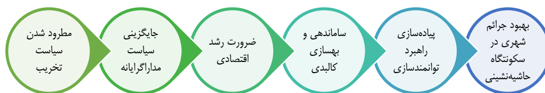
شکل ۱. نمودار ارتباط ساماندهی و توانمندسازی در جرائم شهری

رفتار و شخصیت هر فرد انعکاسی مستقیم و غیرمستقیم واقعیت‌های عینی محیط اجتماعی او در طول زندگی‌اش می‌باشد، اگر در جامعه‌ای ناهنجاری‌ها دیده می‌شود، باید ریشه اش را در درون آن جامعه جستجو کرد. (Sedigh, 2012).