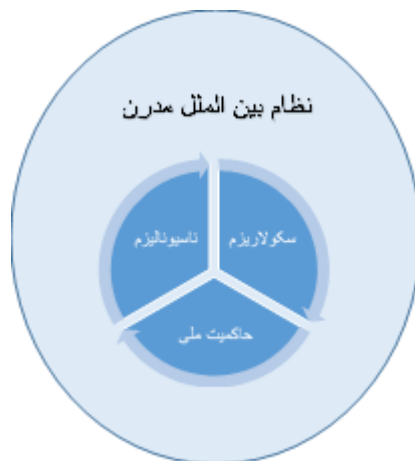
• شکل شماره یک

تحول در ساختار قدرت در جهان به سود جوامع اروپایی که موفق به ساخت دولت-ملت شده بودند، محوری‌ترین پیامد عصر مدرن برای موازنه قدرت در جهان بوده است. متأثر از این پیامد، دولت‌های قدرتمندی در اروپا متولد شدند و پس از مدت کوتاهی بر سر تقسیم دنیای خارج از اروپا که فاقد توان مقابله با این قدرت بود، به رقابت با یکدیگر پرداختند. قدرت‌های اروپایی بخش‌های گسترده از کره زمین تحت سیطره خود درآوردند. این پدیده جدید که با کشورگشایی‌های گذشته متفاوت بود، استعمار ۱۴ نامیده شد. استعمار با سلب حق حاکمیت برای انسان غیر اروپایی، زمینه شکلگیری رابطه سلطه‌گر-سلطه‌پذیر را در سرزمین‌های غیر اروپایی فراهم کرده است (Comaroff & Comaroff, 2001: 641). این روند نهایتاً به جهانی شدن ۱۵ دولت-ملت به عنوان تنها ساختار قابل تصور برای واحدهای سیاسی منجر شد. جهان عرب همزمان با تحولات منتهی به انقلاب صنعتی و شکلگیری دولت مدرن در اروپا، با عبور از سال‌های طلایی قدرت‌گیری اعراب، تحت سلطه ترکان عثمانی قرار داشت. ابتدای جنگ جهانی اول، به نظر می‌رسید که عثمانی در خاورمیانه دست بالا را دارد، اما جنبش ناسیونالیسم عربی با آرزوی استقلال، و با حمایت انگلستان بر علیه امپراتوری اعلام جنگ کرد.