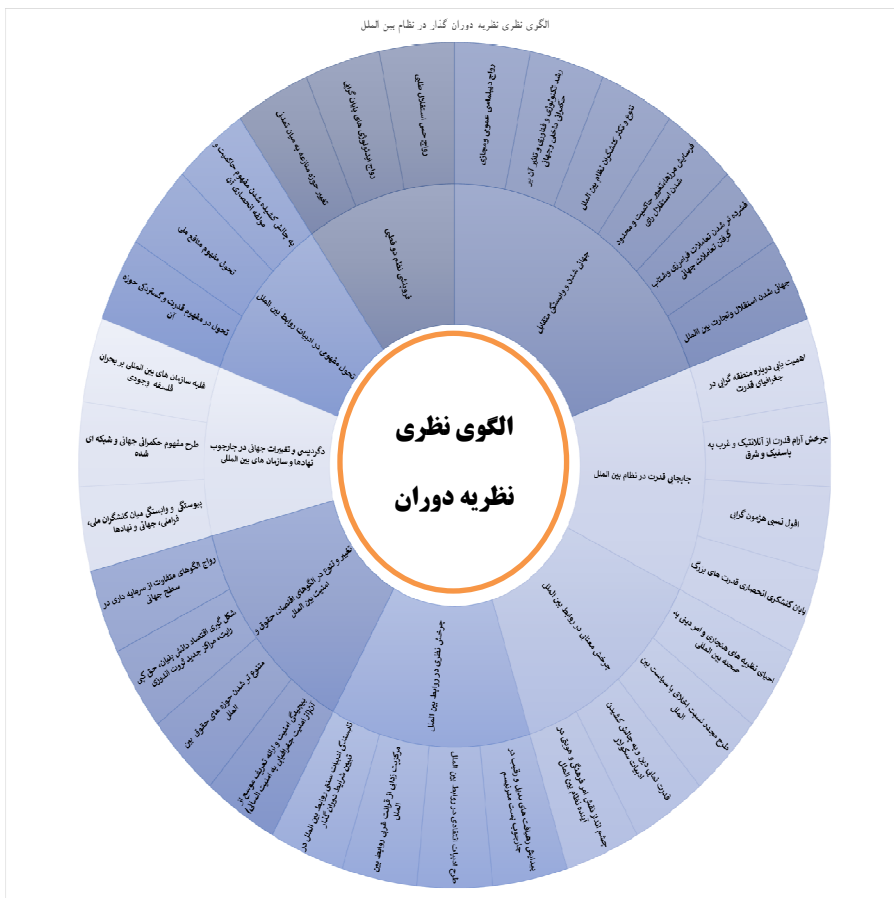
شکل شماره ۲: الگوی نظری نظریه دوران گذار

271) هرچند بر سر امکان یا امتناع مفهوم حکمرانی جهانی میان واقع‌گرایان به‌عنوان مخالف و لیبرال‌ها به‌عنوان پیشگامان طرح ایده حکومت جهانی همچنان اختلاف‌نظر و مناظراتی برقرار است؛ اما حکمرانی جهانی به‌عنوان یک مفهوم نوظهور در ادبیات بین‌المللی دوران گذار بر شیوه متمایزی از سازمان‌دهی به سیاست جهانی در دورانی دلالت دارد که شاخص اصلی آن پیوستگی و ابستگی متقابل میان کنشگران ملی، فراملی و جهانی و کارگزاران، نهادها و سازمان‌های منطقه‌ای و بین‌المللی است که ناگزیرند در مواجهه با چالش‌های جهانی مشترک و نوظهور به اتخاذ سیاست‌های همکاری‌جویانه مبادرت ورزند. (Wolf,2001,187-190) با این استدلال که مشکلات جهانی، راه‌حل‌های جهانی می‌طلبد. الگوی نظری و مفهومی پژوهش بر اساس نظریه دوران گذار در نظام بین‌الملل را می‌توان به‌صورت زیر نمایش داد: