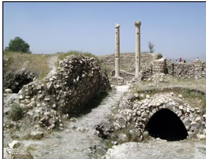
تصویر ۶: مسجد نه چشمه در جنوب شرقی بنای یادبود.