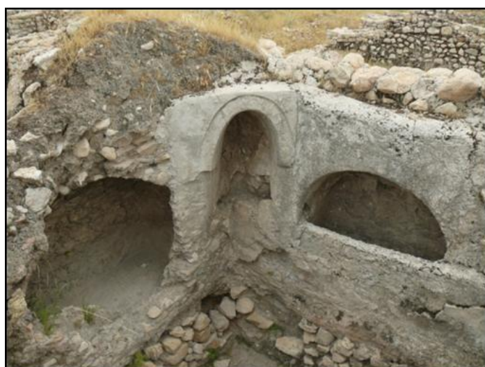
تصویر ۴: مخزن‌های داخل دیوار حمام بیشاپور (عکس از نگارندگان).