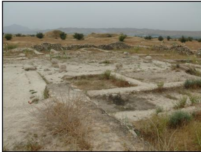
تصویر ۵: تصویری از مدرسه دوره اسلامی بیشاپور.