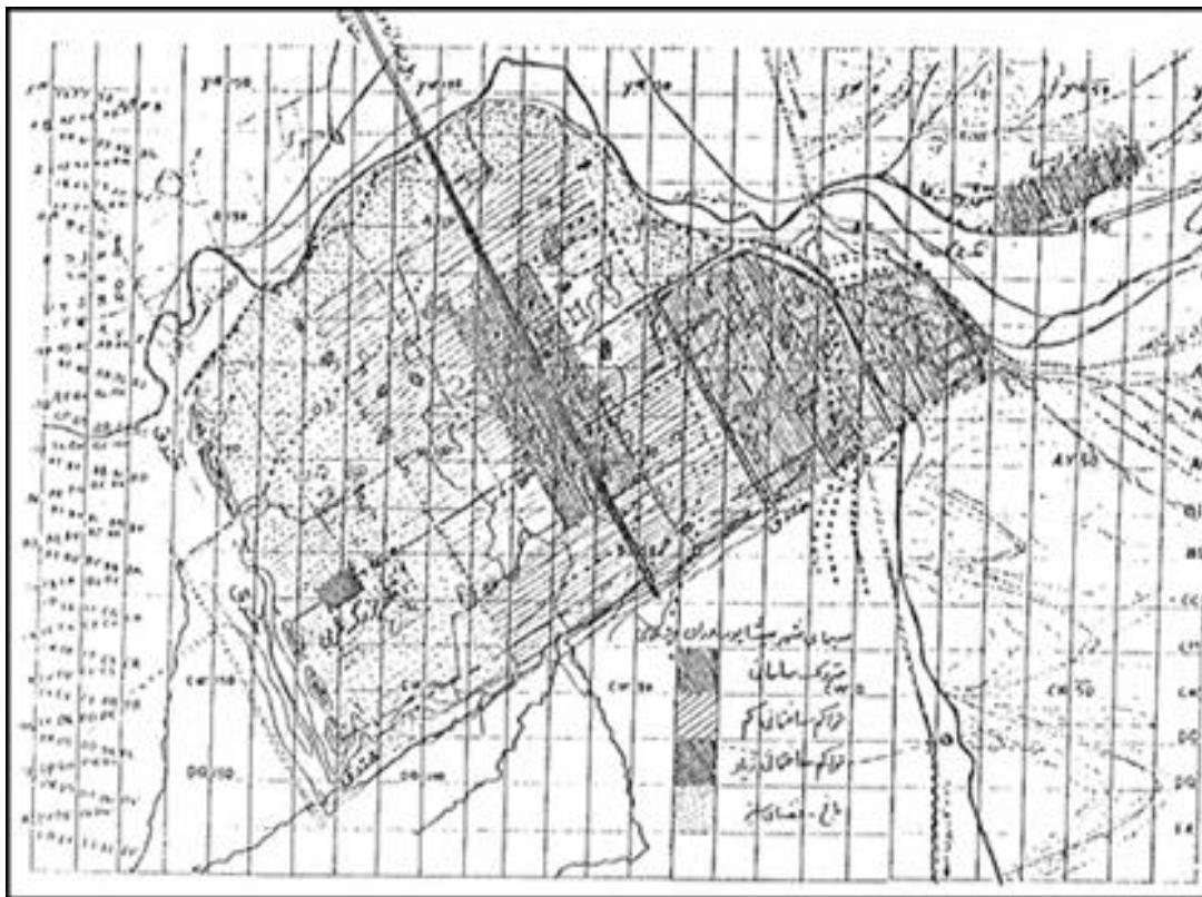
تصویر ۱: تصویر هوایی شهر بیشاپور.