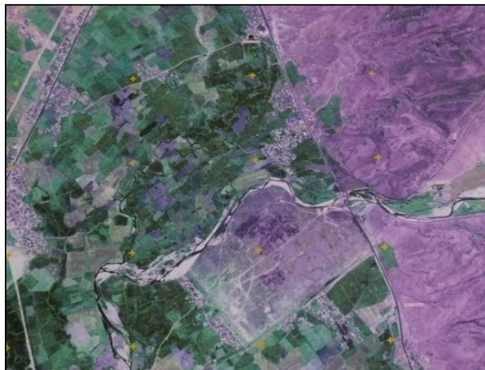
تصویر ۲: تراکم ساختمانی در اندام‌های شهری بیشاپور در دوره اسلامی (مهریار، ۱۳۷۸: ۵۷).