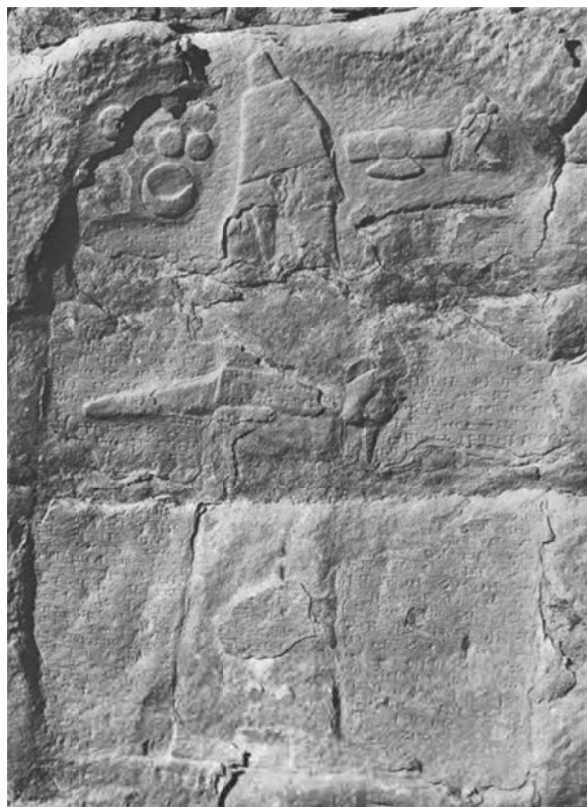
تصویر ۲: تصویری از نقش برجسته اشکفت گل گل (برگرفته از: Vanden Berghe, 1973: PL. XIII).