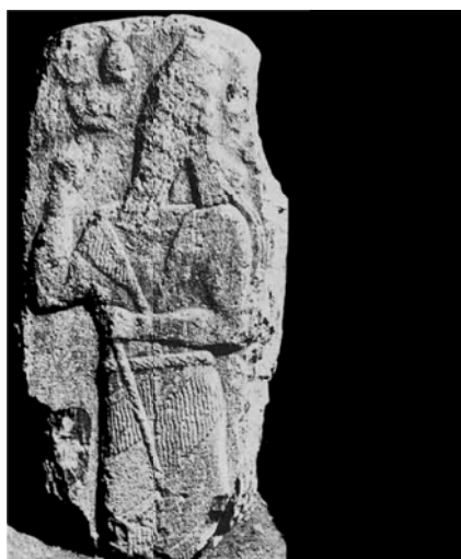
تصویر ۱: سنگ یادمان پیروزی سارگن دوم در نجف آباد اسد آباد (بر گرفته از: Levine, 1971: 43).