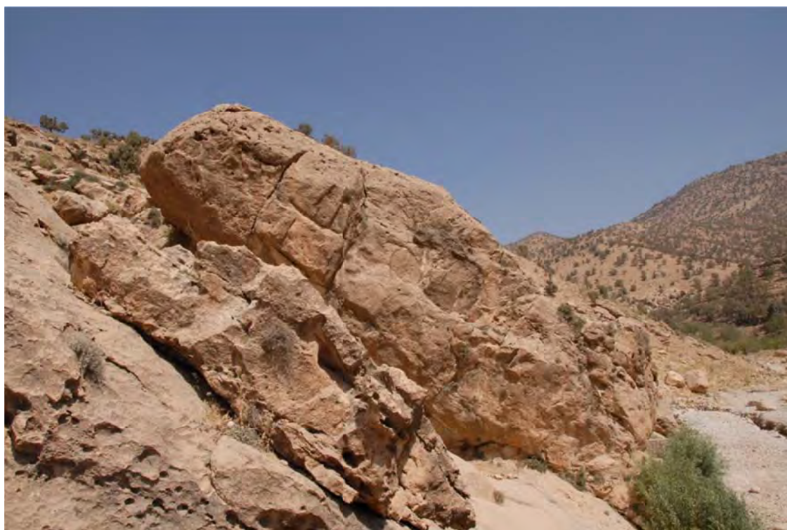
تصویر ۴: موقعیت نقش برجسته آشوری میشخاص بر روی صخره واقع در حاشیه رودخانه میشخاص