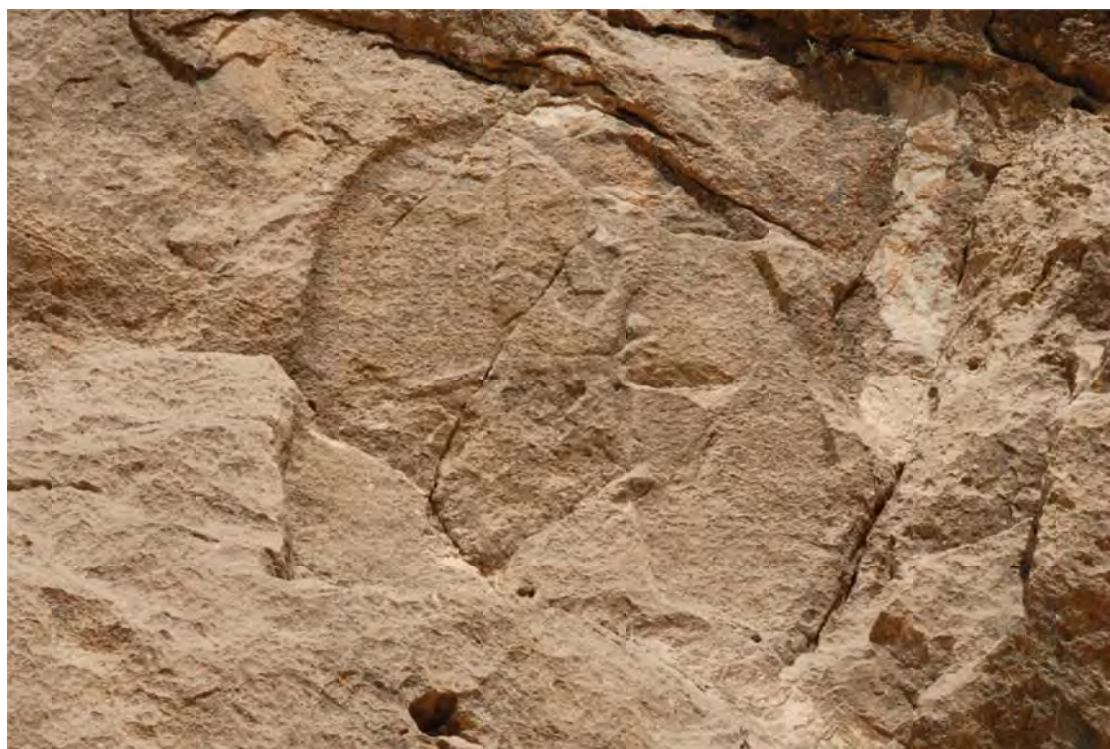
تصویر ۶: نمایی نزدیک از نقش برجسته آشوری میشخاص