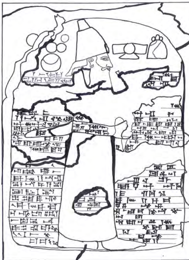
شکل ۲: طرحی از نقش برجسته اشکفت گل گل (برگرفته از مظاهری، ۱۳۸۵: ۷۴).