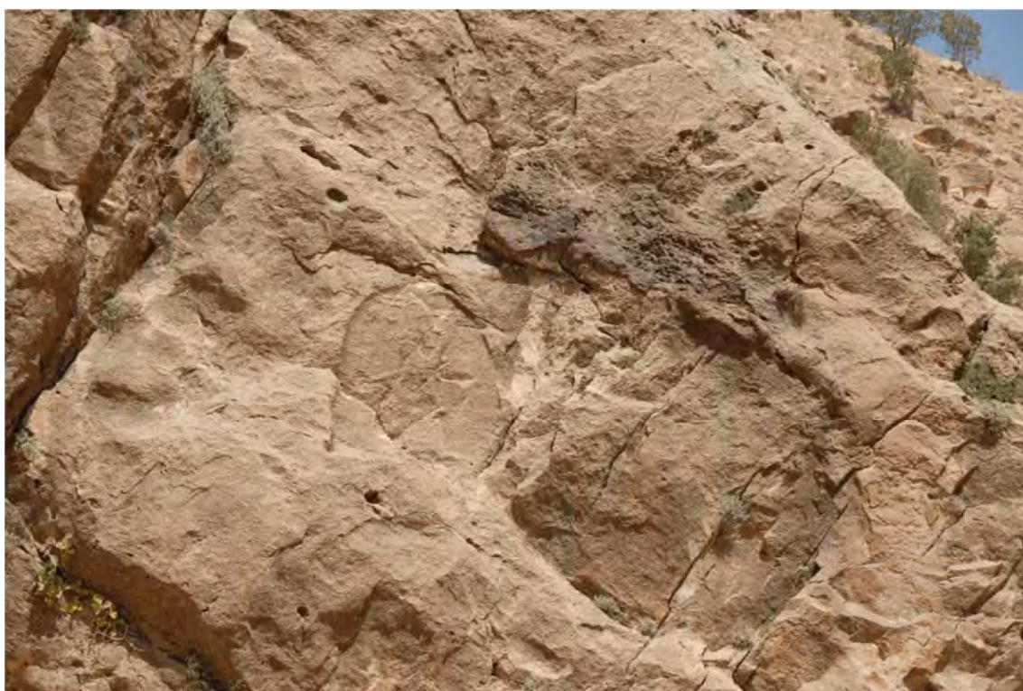
تصویر ۵: نقش برجسته آشوری میشخاص