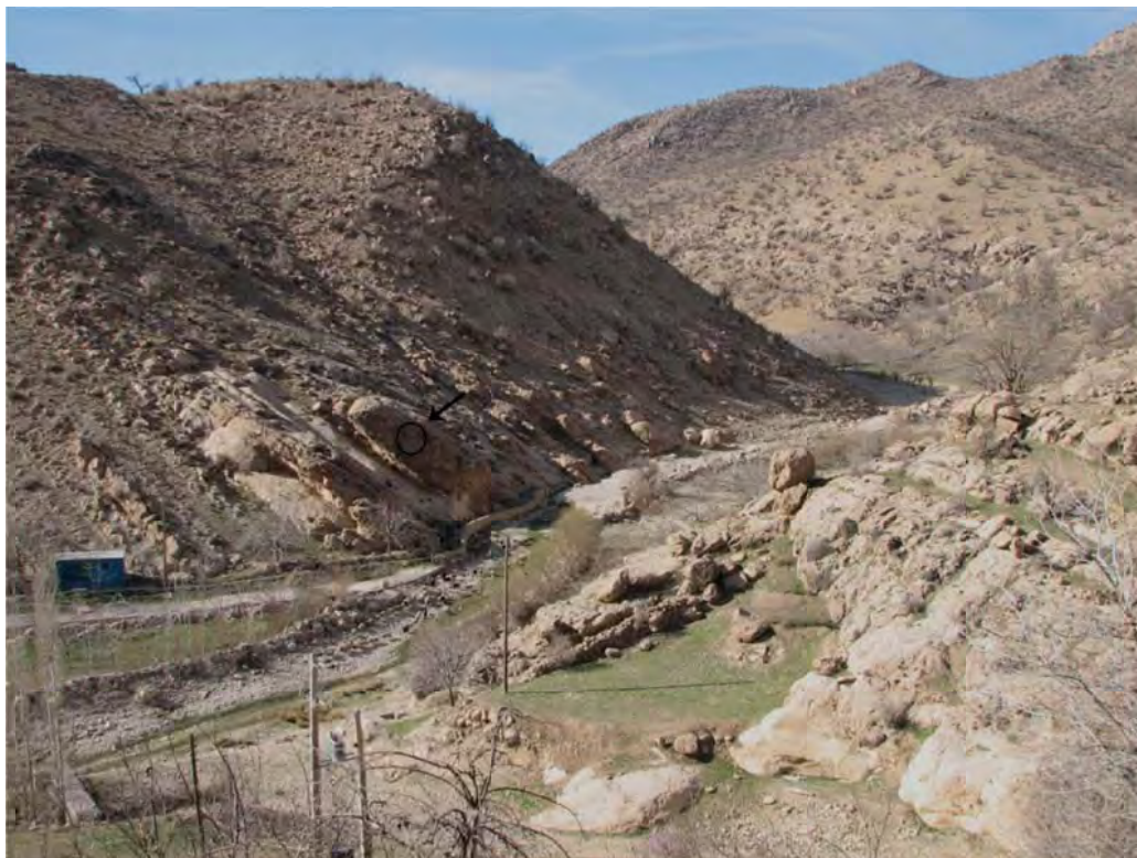
تصویر ۳: دورنمایی از وضعیت قرارگیری نقش برجسته میشخاص نسبت به اطراف.