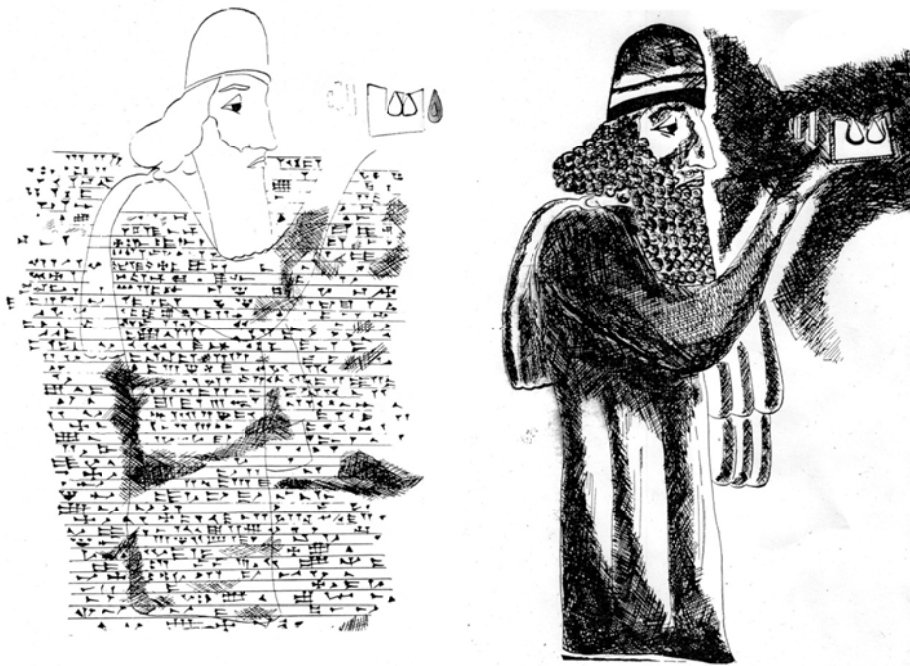
شکل ۱: طرحی از نقش برجسته و کتیبه سارگون دوم در تنگی ور (برگرفته از سرفراز، ۱۳۴۷: شکل های ۳ و ۴).