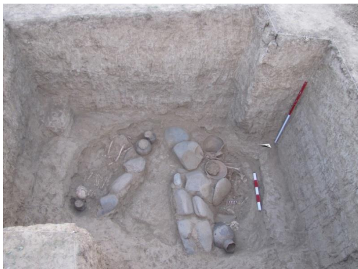
تصویر ۵: تدفین‌های درون گور شماره ۵، ترانشه IV