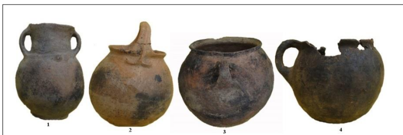
تصویر ۶: نقوش کنده و برجسته به کار رفته روی ظروف سفالی