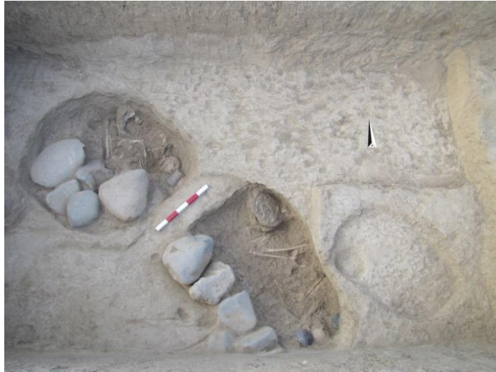
تصویر ۳: گورهای شماره ۲ و ۳ در ترانشه I