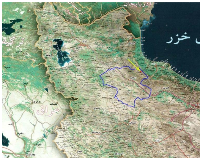
نقشه ۱: موقعیت گورستان جزلان دشت در استان زنجان