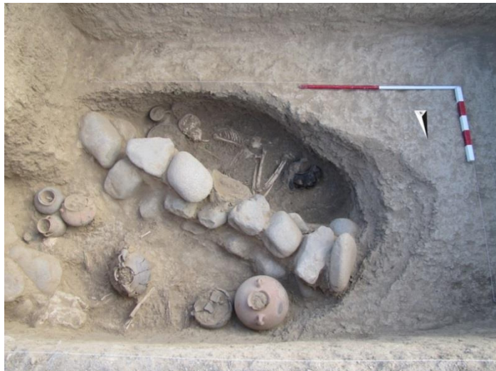
تصویر ۴: تدفین‌های درون گور شماره ۴، ترانشه III