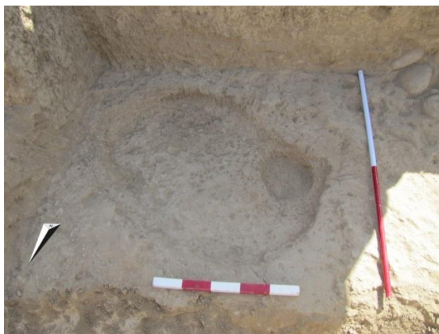
تصویر ۲: گور شماره ۱ در ترانشه I