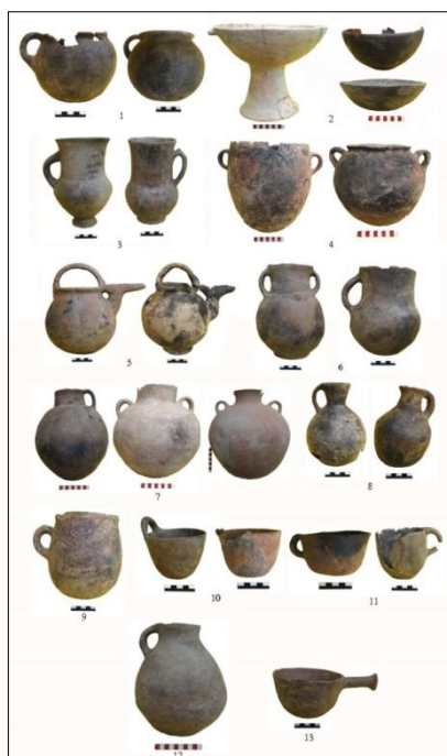
تصویر ۸: عکس گونه‌های مختلف ظروف سفالی