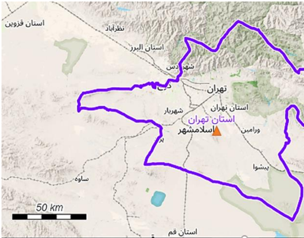
شکل ۶: موقعیت اسلامشهر در استان تهران.