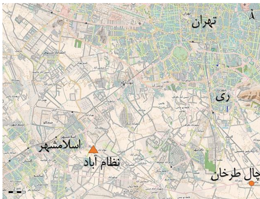
شکل ۴: نقشه موقعیت درست تپه نظام‌آباد در جنوب غرب تهران.

پس از کشف گچبری‌های منحصر به فرد تپه نظام‌آباد در موزه‌های معتبر جایگاه خاصی پیدا کرد اما هیچگاه کاوش علمی مستمری در آن صورت نگرفت. بنابراین پژوهشگران که به بررسی موضوعات گچبری آنجا پرداختند حدس زدند که تپه نظام‌آباد باید در جایی در ۸۰ کیلومتری جنوب شرقی تهران نزدیک به چال طرخان، تپه میل و عشق‌آباد قرار داشته باشد (Heidmann et al., 2014: 40). اما این مکان‌یابی درست نیست: تپه نظام‌آباد در روستای نظام‌آباد در جنوب تهران قرار دارد. نظام‌آباد نام روستایی در نزدیک اسلامشهر است. شهرستان اسلامشهر با مساحتی معادل