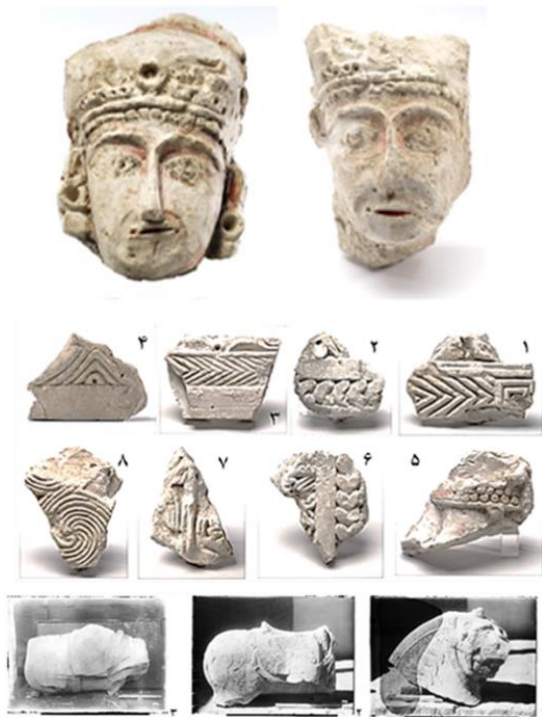
شکل ۵: قطعاتی از گچبری‌های کشف‌شده از تپه نظام‌آباد.

نقوش هندسی شامل دواپر، لوزی‌ها، چهارگوش، دالبری، مثلث است و نقوش ترکیبی شامل تاق‌ها یا قاب‌های مرواریدنشان و یا ترکیبی از نقوش گیاهی و هندسی با هم دیده می‌شود. بخش‌هایی از گچبری‌های کشف‌شده از تپه نظام‌آباد را عناصر وابسته به معماری تشکیل می‌دهد. در این بین قاب گچی و نقش طاق هلالی به چشم می‌خورد.