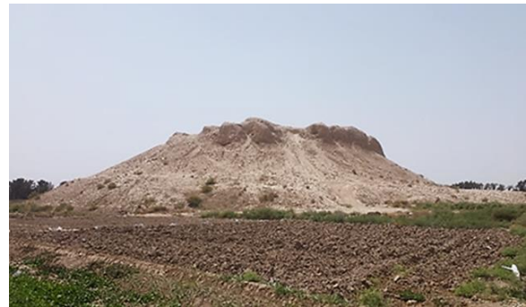
Figure 2: The view of Nizam-Abad (A. Hozhabri, July 2023).

In summary, Tepe Nezām-Ābād (Fig. 2), which contained the unique plaster decorations that gained fame in reputable museums, is actually located in the village of Nezām-Ābād in southern Tehran, and not in the southeastern area about 80 km from Tehran as previously thought by researchers. The precise location of this important archaeological site has now been clarified (Fig. 3).