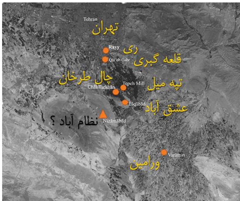
شکل ۳: موقعیت فرضی (۱؟) تپه نظام‌آباد (Encyclopaedia Iranica).

با انتشار عکس‌هایی در سال ۱۹۲۵ میلادی توسط ارنست هرتسفلد از گنجبری‌های بی‌نظیری تپه نظام‌آباد این تپه مشهور شد اما در مورد موقعیت آن از آن سال تا امروز تردیدهایی وجود دارد و پژوهشگران غالباً موقعیت آن را در ۸۰ کیلومتری جنوب شرق تهران آورده‌اند (Heidmann et al., 2014: 40; Rante, 2010). اما بررسی این موضوع نشان داد که این محوطه در نقطه‌ای دیگر در جنوب غرب تهران و جنوب شرق اسلامشهر کنونی قرار دارد.