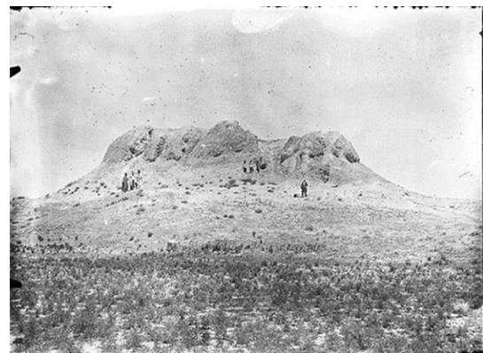
Figure 1: View of Nizam-Abad (Herzfeld, 1925).

Among these, one of the most important sites that displays the transitional period from the Sasanian period to the Islamic era is "Tepe Niẓām-Ābād". A number of unique plaster decorations from this mound were unearthed in 1925, and Ernst Herzfeld immediately went to the site, photographed them (Fig. 1), and purchased as many as possible, transferring them to the Kaiser Friedrich Museum. After World War II, many of these artifacts ended up in the Museum Island in Berlin.