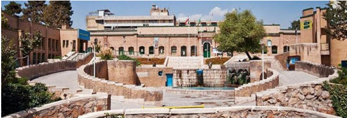
شکل ۳- فرهنگسرای شفق