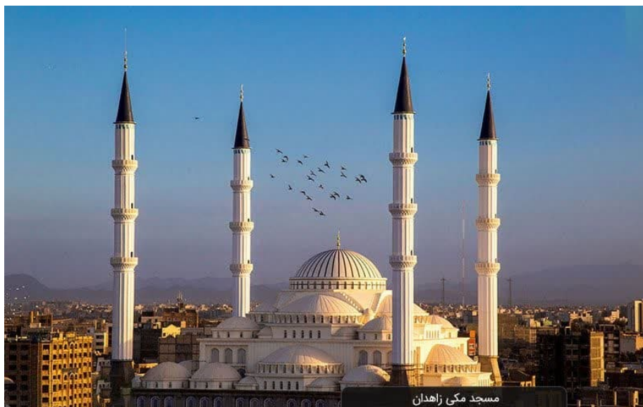
شکل ۱: نمایی از مسجد مکی زاهدان-قطب اهل سنت شرق کشور

عموما بازاری و تاجر این محله را برای سکونت انتخاب نمایند. که این موضوع موجب علاقه‌مندی محققان به بررسی شرایط این محله گردیده است.