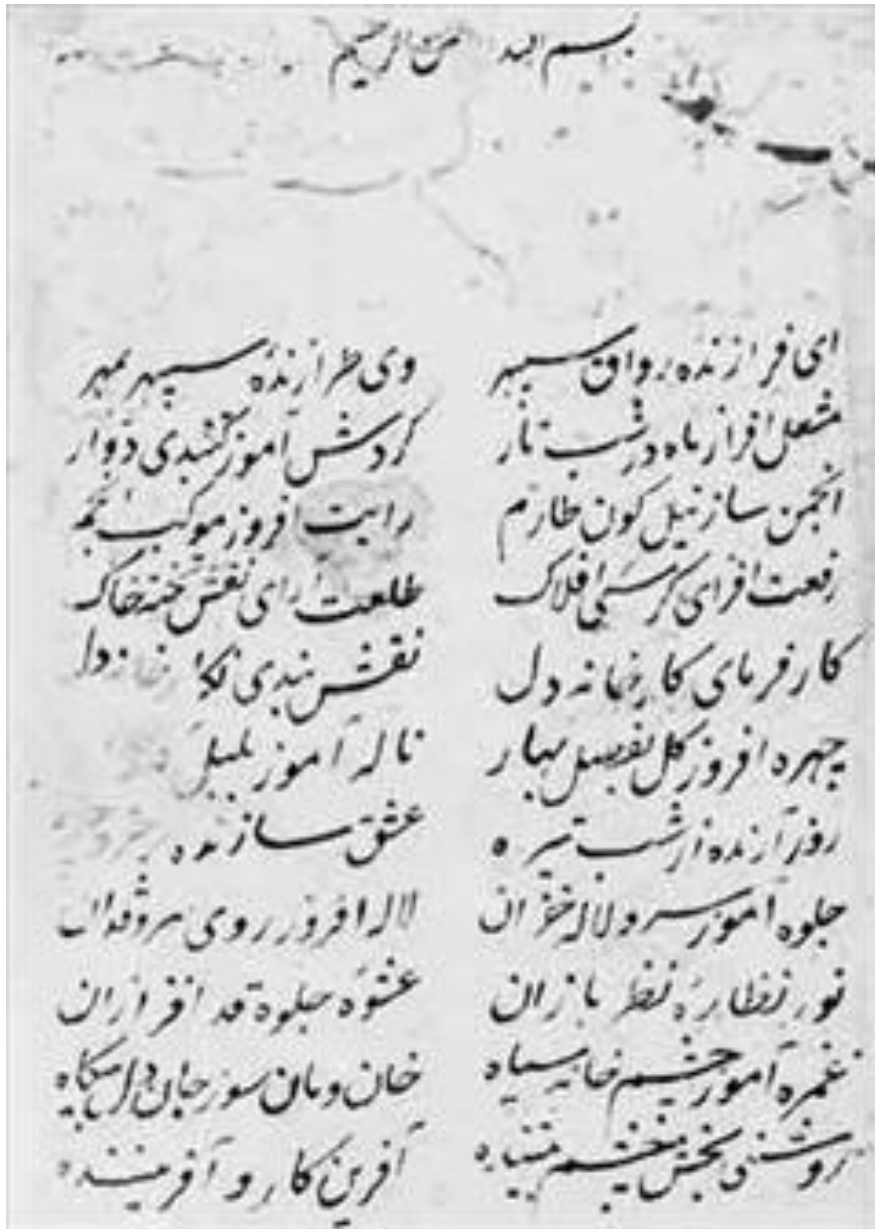
تصویر ۳: صفحه اول نسخه

کتابخانه: کتابخانه مرکز بین‌المللی میکروفیلم نور دهلی؛ موضوع: منظومه؛ زبان: فارسی؛ شماره کتاب: ۱۴۲