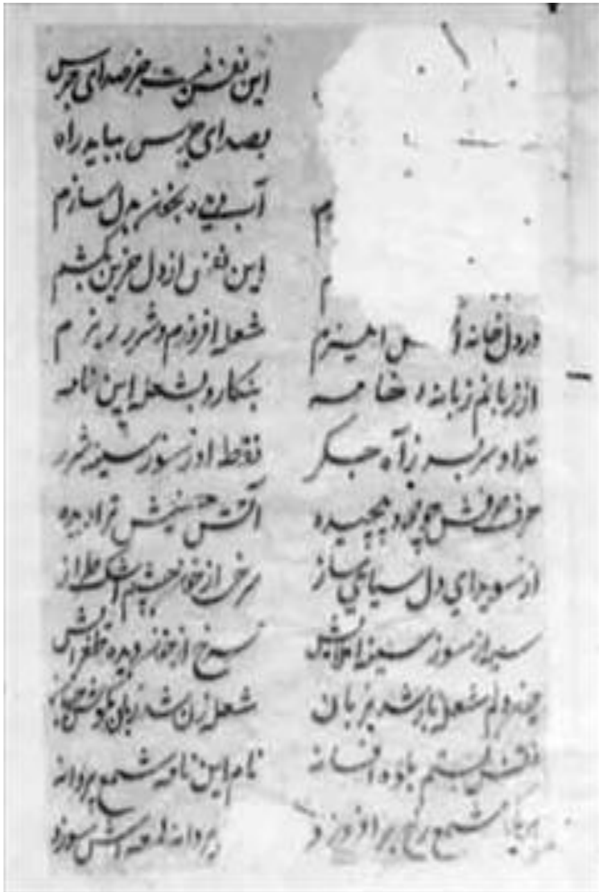
تصویر ۲: شماره صفحه مشخص نیست

کتابخانه: مولانا آزاد دانشگاه اسلامی، علیگر؛ جلد اول؛ موضوع: منظومه؛ زبان: فارسی؛ شماره کتاب: ۳۷۶