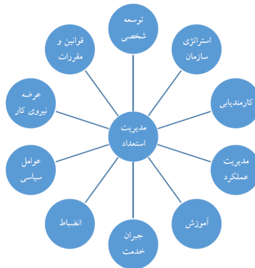
شکل ۱. شاخص‌های مدیریت استعداد در پالایشگاه گاز فجر جم