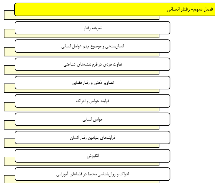
شکل ۷- تحلیل محتوای فصل سوم - رفتار انسانی- (مأخذ: نویسنده اثر - محمد دبده)

راهنمای فصل سوم - رفتار انسانی، براساس (شکل ۷).