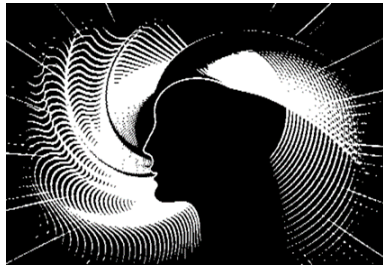
شکل ۵- رابطه انسان با جهان هستی - (مأخذ: نگارندگان)

انسان برای برقراری ارتباط و تعامل مناسب با محیط کالبدی اطراف به دریافت اطلاعات نیازمند ادراک محیط می‌باشد که انسان از طریق آن داده‌های لازم را براساس نیاز از محیط پیرامون برمی‌گزیند (دبده، ۱۳۹۵). اولریک نیسر ۴۱ معتقد بود، انسان در هر مرحله ادراک، هم قطب درون و هم قطب بیرون به صورت هم‌سنگ بر یکدیگر تأثیر دارند. به بیان دیگر، هیچ انسانی با محیط ارتباط برقرار نمی‌کند مگر آنکه اسکیمما ۴۲ و انگیزه اکتشاف داشته باشد. دریک تقسیم‌بندی ادراکات انسانی را می‌توان به ادراک شنوایی، ادراک بینایی، ادراک بویایی و ادراک لامسه براساس (شکل ۴)، تقسیم کرد طوری که هر یک جایگاه متمایزی نسبت به یکدیگر دارند. در فلسفه، ادراک از مباحث مهم شناخت‌شناسانه و مهمترین گام در شناخت خویش و هستی بوده و سهم اساسی در بازشناسی نوع رابطه انسان با کیهان دارد براساس (شکل ۵).