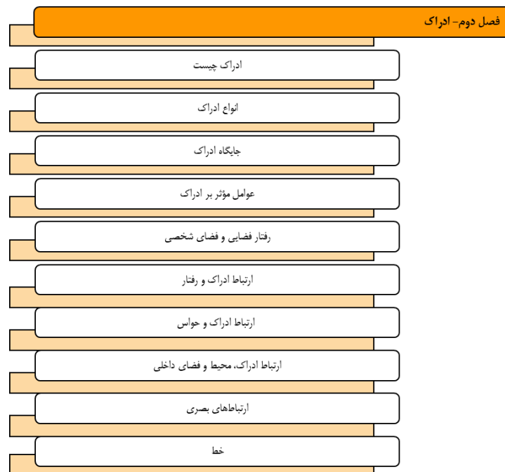
شکل ۳- تحلیل محتوای فصل دوم - ادراک - (مأخذ: نویسنده اثر - محمد دبدبه)

راهنمای فصل دوم - ادراک، براساس (شکل ۳).