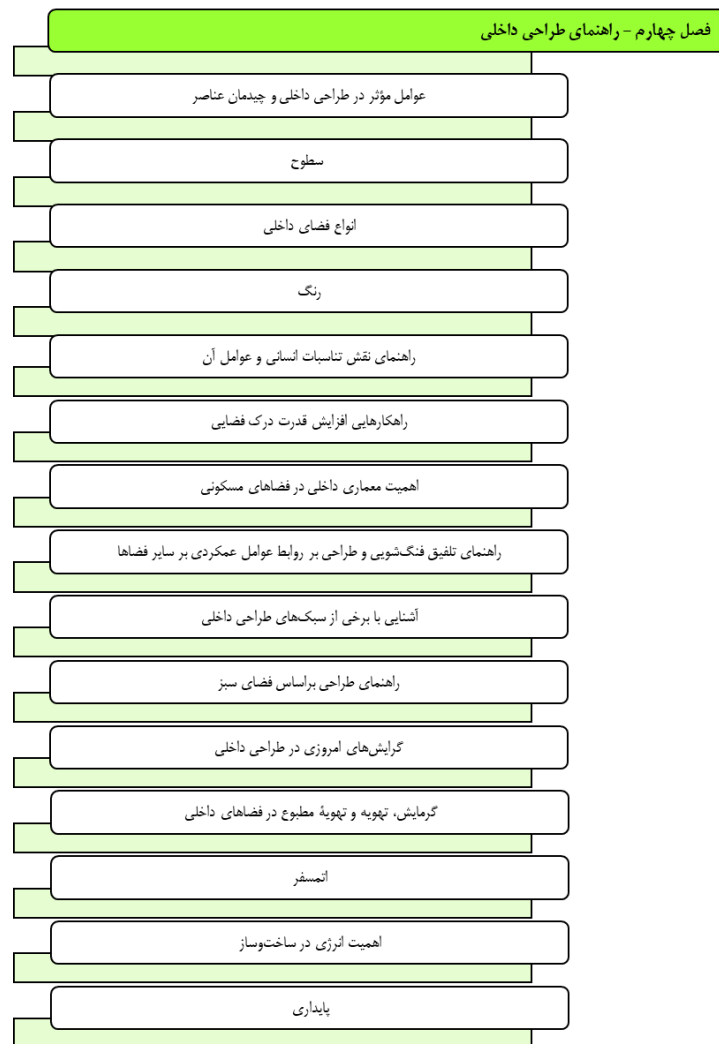
شکل ۸- تحلیل محتوای فصل چهارم - راهنمای طراحی داخلی - (مأخذ: نویسنده اثر - محمد دبده)

راهنمای فصل چهارم - راهنمای طراحی داخلی، براساس (شکل ۸).