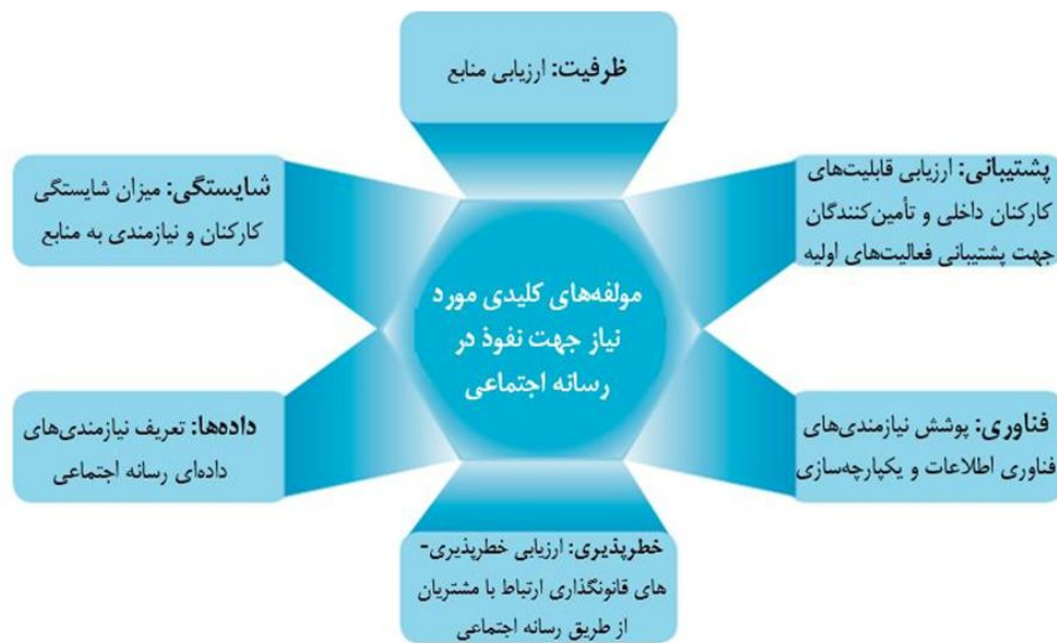
شکل ۱. مؤلفه‌های کلیدی مورد نیاز جهت نفوذ در رسانه اجتماعی

داده‌ها: از آنجایی که داده‌هایی حساس و در سطحی وسیع در دسترس قرار می‌گیرد (یعنی، اطلاعات شخصی از