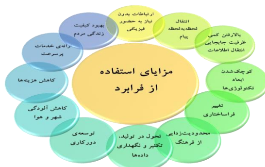
مدل مزایای استفاده از فرابرد

۳- محدودیت زدایی از فرهنگ؛ در این جا افراد یک جامعه،