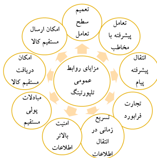
مدل مزایای روابط عمومی تله‌پورتیشن