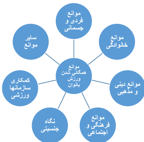
شکل ۲- مدل مفهومی موانع همگانی شدن ورزش بانوان

خصوص ورزش بانوان به عمل نیامده است و همگان از وضعیت موجود ناراضی هستند. توزیع غیر صحیح تجهیزات و امکانات باتوجه به جمعیت هر منطقه و همچنین کمبود و ناکافی بودن منابع مالی سازمان تربیت بدنی برای ایجاد اماکن ورزشی بانوان سبب شده که این معضل کمبود مکان‌های ورزشی بانوان با اعتبارات فعلی حل نشود. اما نوآوری در این پژوهش ضعف برنامه‌ریزی جامع و صحیح؛ کمبود نیروی انسانی متخصص و عدم داشتن برنامه برای پیشرفت ورزش بانوان و عدم تصمیم‌گیری و برنامه‌ریزی برای ترغیب و تسهیل حضور حمایتگران مالی در ورزش همگانی بانوان در کنار عدم جذابیت فعالیت‌های برنامه ورزش همگانی و عدم توجه به ورزش‌های بومی و