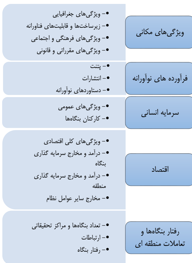
شکل ۲. مدل نهایی ارزیابی نظام نوآوری منطقه‌ای

به‌طور کلی نظام نوآوری منطقه‌ای را می‌توان حاصل تعامل دروندادهای منطقه‌ای از قبیل سازمان‌ها، بنگاه‌ها و نهادهای رسمی و غیررسمی دولتی و غیردولتی دانست که در مجاورت یکدیگر منجر به خلق، به‌کارگیری و توزیع دانش و درنهایت افزایش نوآوری و رقابت‌پذیری در سطح منطقه می‌شود. اهمیت مدل‌های نوآوری منطقه‌ای مانند نظام نوآوری منطقه‌ای در دهه‌های اخیر، به علت اهمیت یافتن مراکز و خوشه‌های اقتصاد منطقه‌ای و تمرکز بیشتر بر سیاست‌های نوآوری منطقه‌ای افزایش قابل توجهی یافته است. در این راستا هدف پژوهش حاضر، شناخت ابعاد، مولفه‌ها و شاخص‌های ارزیابی نظام نوآوری منطقه‌ای جهت تعیین عملکرد این نظام در یک منطقه خاص است. بنابراین به‌منظور شناسایی مفهوم نظام نوآوری منطقه‌ای بر مبنای مصاحبه با خبرگان و به‌کارگیری تکنیک‌های تحلیل مضمون و دلفی فازی ابعاد ناظر بر ارزیابی نظام نوآوری منطقه‌ای به پنج دسته تقسیم شدند. مدل نهایی ابعاد و مولفه‌ها در شکل ۲ مشخص شده است.