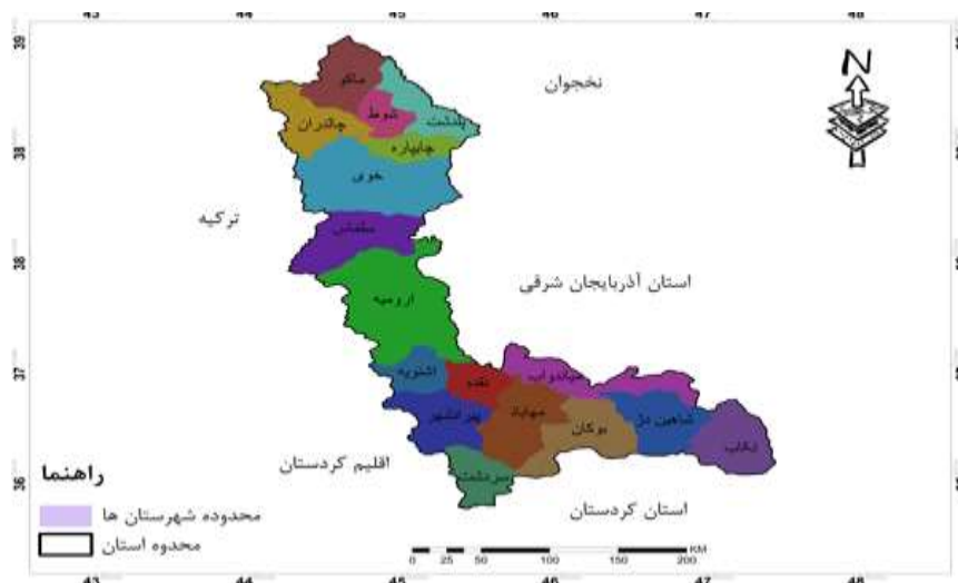
شکل ۱: منطقه مورد مطالعه