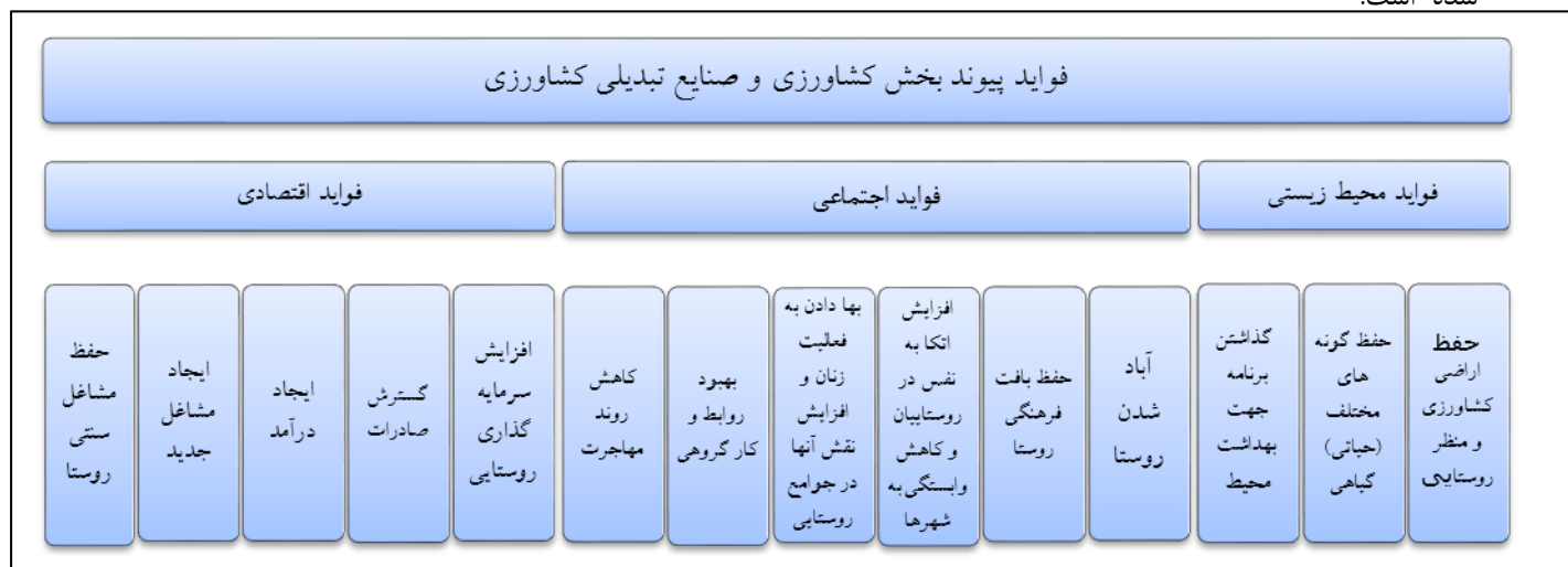
شکل ۱- فواید پیوند کشاورزی و صنایع روستایی - منبع: پوررمضان و اکبری، ۱۳۹۳، ص ۱۴۹.

کشاورزی و به ویژه کشاورزی تولیدی، مشتری مهم نهاده‌های محلی مرتبط با مزرعه و نهاده های مشاغل خدماتی است. همچنین کشاورزی می تواند محصولاتی را برای فرایندهای محلی یا صنایع (مشاغل کشاورزی و صنایع غذایی فراهم کند (Rezvani and et al, 2014:24). در مکتب رهووت، توسعه همه جانبه روستایی به تحول بخش کشاورزی به عنوان محرک اصلی نظر دارد و بدین منظور یک تغییر تدریجی اما حتمی از کشاورزان معیشتی به کشاورزان تجاری پیش بینی می‌شود که در آن صورت وابستگی کامل کشاورزی به صنایع تبدیلی، قطعی خواهد بود (Papeli Yazdi and Ebrahimi, 2002:56). همچنین راهبردی است که فقر روستایی را کاهش داده و با توسعه صنایع از دیدگاه اقتصاد روستایی و اقتصاد ملی، توسعه متعادل میان خانوارهای شهری و روستایی، بخش کشاورزی و صنعت و تعادل در اقتصاد منطقه ای و تمرکز زدایی صنعتی و شهری را میسر می سازد (Barghi and et al, 2014:132). پتانسیل بالای صنایع خانگی (مثلا بسته بندی محصولات) جهت ایجاد اشتغال ثابت شده است (Thanaga joy and kani, 2013:2). به کارگیری صنایع تبدیلی در کنار فعالیت‌های بخش کشاورزی به طور کلی دارای فواید متعدد اقتصادی، اجتماعی و زیست محیطی می‌باشد که به اختصار در شکل ۱ نشان داده شده است.