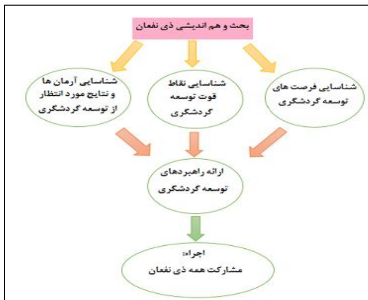
شکل ۳- مدل مفهومی راهبردهای توسعه گردشگری SOAR در کلان‌شهر تبریز

با توجه به رویکرد مشارکتی مدل SOAR می‌توان دستیابی به توسعه گردشگری در کلان‌شهر تبریز را به صورت شکل زیر نشان داد.