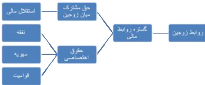
شکل شماره (2)- تهیه و تنظیم از مولف براساس مندرجات

در این پژوهش آیات قرآنی مرتبط با خانواده، استخراج و مطالعه شدند، سپس درگستره‌ی روابط مالی میان زوجین به عنوان مصادیقی از ابداع تشریح عدالت درون‌خانه‌ای، با مراجعه به تفاسیر معتبر به تفکیک مورد شرح و بررسی قرار گرفتند؛ معیار عملیاتی عدالت جنسیتی در تفکر اصیل اسلامی، به صورت تساوی کامل در حقوق انسانی و تفاوت‌های مبتنی بر خصوصیات جسمی، روحی و نقش هر یک از زوجین در خانواده قابل طرح است؛ بدین ترتیب که در هر یک از گستره‌های حق و تکلیف، قانونگذار اسلامی ابتدا یک حق مشترک انسانی را در قالب یک کلیت برای هر دو جنس، صرف‌نظر از نقش‌هایی که به عنوان زن و شوهر در خانواده بر عهده دارند، به رسمیت شناخته و در احکام جزئی‌تر، حقوق و تکالیف اختصاصی متناسب با ویژگی‌های هر یک از زوجین را معرفی و تبیین نموده است (نمودار 2).