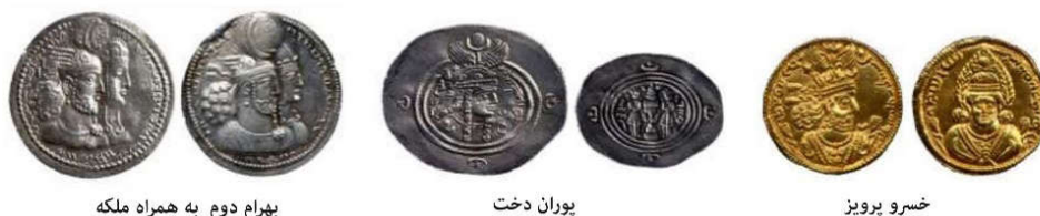
بهرام دوم به همراه ملکه

سکه‌ها، اسنادی معتبر و مکتوب هستند و از منابع مهم برای بررسی فرهنگ، تاریخ، تطور زبان، اقتصاد حکومت‌ها و باورهای مردمان تابع آن‌ها به‌شمار می‌آیند (سیدخلیل‌اللهی و ابوالقاسمی، ۱۳۹۸: ۱۹۸) و نشان‌دهنده وجود ارتباطات تجاری در حوزه نفوذ و گسترش قدرت سیاسی حاکم هستند (نعمتی، شریفیان و صدرایی، ۱۳۹۸: ۱۱۶) همان‌گونه که کتیبه‌ها و نقوش برجسته‌های ساسانی بسیاری از مسائل تاریخی را مجسم می‌کنند، سکه‌ها هنر و فرهنگ ساسانی را دقیق‌تر و کامل‌تر جلوه‌گر می‌سازند (سرفراز و آورزمانی، ۱۳۸۸: ۸۷) در میان ۳۳ شاه دودمان ساسانی که از خود سکه‌برجای نهادند تنها روی یا پشت سکه‌های سه تن از شاهان ساسانی نقش زن یا ایزد آناهیتا را مشاهده می‌شود. در بعضی از سکه‌های بهرام دوم (حک ۲۷۶-۲۹۳ م) تصویر سه‌گانه شاهنشاه، بانوی بانوان (شاپوردختک) و جانشین شاه نقش شده است و در اواخر سلسله ساسانی نیز سکه‌هایی از خسرو پرویز (حک ۵۹۱-۶۲۸ م) روی سکه تصویر خسرو پرویز و پشت سکه به جای آتشدان تصویر چهره آناهیتا در میان شعله‌های آتش دیده می‌شود؛ ملکه پوران دخت (حک ۶۳۰-۶۳۱ م) نیز روی سکه‌ها با گیسوانی بلند مزین به گل‌هایی از گوهرهای باشکوه نشان داده شده است؛ ملکه آذر میدخت (حک ۶۳۱ م) فرزند خسرو پرویز خود را پیرو پدر می‌دانست و از روی شرم و حیا، به جای چهره خویش، عموماً چهر پدر را بر سکه‌هایش نقش کرد (امینی، ۱۳۸۹: ۲۵۱) (تصویر ۲).