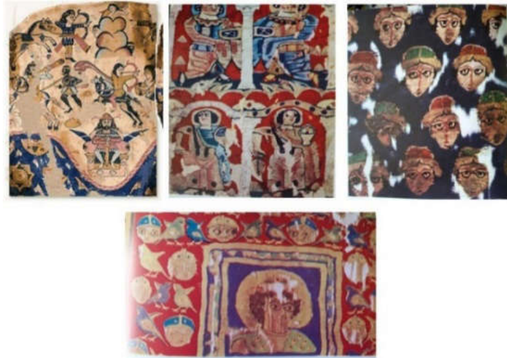
تصویر ۳. نقش زن روی پارچه‌های ساسانی (گیرشمن، ۱۹۷۱، ترجمه فرهوشی، ۱۳۹۰: ۲۳۶، ۳۱۰، ۳۱۱)