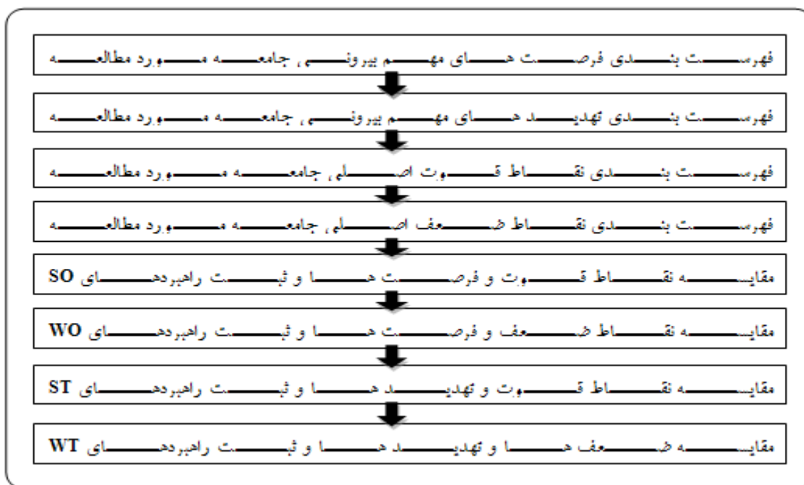
شکل شماره ۱- نمودار مراحل تهیه مدل سوات

۴۰). این تکنیک شامل یک فرآیند ۸ مرحله ای می باشد، که در نمودار ۱-۴ ارائه شده است.