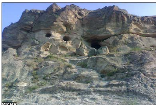
شکل ۹- سکونتگاه زیرزمینی ویند کلخوران

ویند کلخوران اردبیل: دهکده صخره ای باستانی ویند در حدود ۵ کیلومتری جنوب و جنوب غربی سرعین و در نزدیکی جاده اردبیل - نیر قرار گرفته است. مناطقی که خانه‌های سنگی در آن قرار گرفته‌اند قوردی قیه، تپه چله خانه، قره قیه و مسجدیری نامیده می‌شود. این روستا دهکده‌ای سنگی با مجموعه‌ای از خانه‌های سنگی منفرد به صورت یک پدیده معماری تاریخی و باستانی استثنایی وجود دارد که شکل کنده شدن این منازل در زیر تپه های سنگی و رسوبی و نوع کنده شدن آنها که در نهایت به آفرینش چنین آثاری منجر شده است، در نوع خود کم نظیر است (صادقی مغانلو، ۱۳۸۲). بررسی‌های محدود و سفالهای پراکنده در سطح و داخل خانه‌های سنگی مربوط به ادوار مختلف است. سفال‌هایی مربوط به دوره اشکانی، سفال‌ها و قوس‌های جناغی در کنده های صخره ای شبیه به آثار ساسانیان همچنین