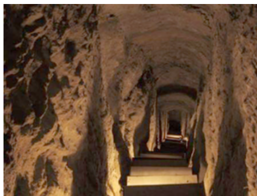
شکل ۲- سکونتگاه زیرزمینی اویی (نوش آباد) منبع:

انسان قرار دارد. در بدو امر تصویری که روستا در مقابل دیدگان بیننده از خود ارائه می‌کند تنها درهای کوتاه سیاه رنگی است که ظاهراً به دهلیز یا حفره‌ای که پشت آن قرار گرفته اند چسبیده است. این درها همه در یک سطح نبوده بلکه در طبقات مختلف گاهی تا ۵ طبقه روی هم قرار گرفته‌اند (حاتمی، ۱۳۸۰: ۱). همه خانه‌های این روستا در دل کوه، همانند یک سری غارهای بزرگ کنده شده و تنها ارتباط بین داخل و خارج این ابنیه زیرزمینی، در ورودی است. این در هم محل ورود و خروج اهالی خانه و هم جهت تأمین نور و تهویه است. این ساختمان‌ها از نظر آسایش حرارتی بسیار پایدار هستند، زیرا بدنه آنها سنگ یکپارچه است. نوسان درجه حرارت در طی شبانه روز بسیار اندک است و باد و باران به داخل آن نفوذ نمی‌کند و در مقابل آتش سوزی مقاوم است. البته در داخل خانه‌ها تهویه به خوبی صورت نمی‌گیرد و روشنایی طبیعی آنها نیز کافی نیست (قبادیان، ۱۳۸۷، ۲۹) در سال ۲۰۰۵، جایزه نخست ملینا مرکوری، به سبب حفظ و تعامل با طبیعت به روستای میمند اختصاص یافت. این روستا "هفتمین منظر زندگی"، طبیعی و تاریخی جهان است که جایزه مرکوری جایزه‌ای است که از سوی دولت یونان و با همکاری مجامع فرهنگی - بین‌المللی مانند یونسکو و ایکوموس (شورای حفاظت از بناها و محوطه‌های تاریخی) به آثاری اهدا می‌شود که دارای شرایط و ضوابط فرهنگی، طبیعی و تاریخی منحصر به فرد باشد (دهقان، حمید، ۱۳۹۰، ۴۲)