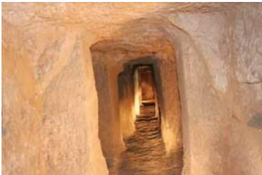
شکل ۷- سکونتگاه زیرزمینی ارزانفود

ورودی و به صورت مستقل هستند. نمونه مشابه شهر سامن را در حدود ۱۵ کیلومتری ملایر روستای انوج، حدود ۴۵ کیلومتری جنوب غرب ملایر، مجموعه زیرزمینی روستای کمری در ۵۰ کیلومتری شمال ملایر را می‌توان نام برد. (خبرگزاری جمهوری اسلامی، ایرنا، ۱۳۹۱)