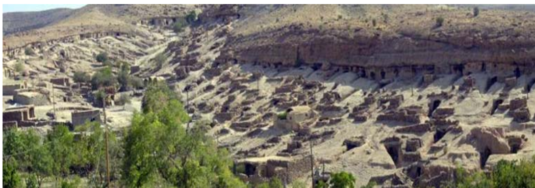
شکل ۳- سکونتگاه زیرزمینی میمند، پایگاه اینترنتی سازمان میراث فرهنگی میمند، ۱۳۹۱

انسان‌ها در این ساختار مشاهده می‌شود. (پایگاه اطلاع‌رسانی سامن، ۱۳۹۱)