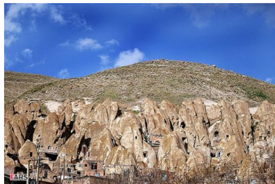
شکل ۱- سکونتگاه زیرزمینی کندوان، منبع: خبرگزاری

در این محیط عوامل کالبدی محیط زیست انسان از بین عوامل کاملاً طبیعی انتخاب شده و تلفیق عجیبی بین کالبد مسکونی و رفتار انسان بعمل آمده و در واقع این هردو در هم تأثیر گذاشته‌اند. نکته مهم اینکه هنوز بعد از گذشت قرن‌ها، تغییر چندانی در زندگی انسان‌های ساکن این مجموعه دیده نمی‌شود. طبیعت ثابت، فرم زندگی را ثابت نگه داشته زیرا عامل فیزیکی در این بحث، سنگ است، سنگی که جزئی از یک کوه رفیع است و لاجرم تغییر ناپذیر و با دوام و شکل ظاهری زندگی اجتماعی کوچک کندوان در رابطه جدا نشدنی با فرم کالبدی این محیط قرار گرفته و انسانها، سنگین و تغییر ناپذیر در مقابل عوارض طبیعی مثل پلاد سخت و غیر قابل نفوذ باقی مانده‌اند و چنان است طرز فکرشان در مقابل سیر تغییرات و تحولات (مجتهد زاده، ۱۳۵۳: ۱۵۰).