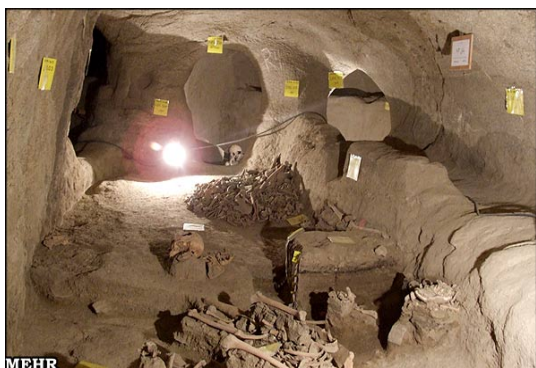
شکل ۴- سکونتگاه زیرزمینی سامن

انسان‌ها در این ساختار مشاهده می‌شود. (پایگاه اطلاع‌رسانی سامن، ۱۳۹۱)