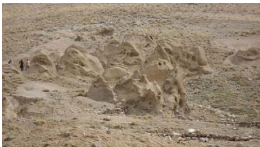
شکل ۵- سکونتگاه زیرزمینی حیل‌ه‌ور

کندوان از نظر علمی باید عقبه قوی داشته باشد و حیل‌ه‌ور و کندن آن در دل کوه‌ها و زیرزمین پیشینه‌ای بود برای کندن ماهرانه کندوان و انتخاب هوشمندانه آن. (سایت سازمان میراث فرهنگی استان آذربایجان شرقی، ۱۳۹۱)