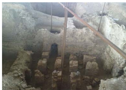
شکل ۸- سکونتگاه زیرزمینی ذلف آباد، منبع

تاریخی ذلف آباد بیش از ۱۳۰هکتار وسعت داشته و به لحاظ موقعیت سیاسی، اقتصادی و فرهنگی محدوده قابل توجهی را در فراهان شامل می‌شده است (خبرگزاری جمهوری اسلامی، ایرنا، ۱۳۹۱).