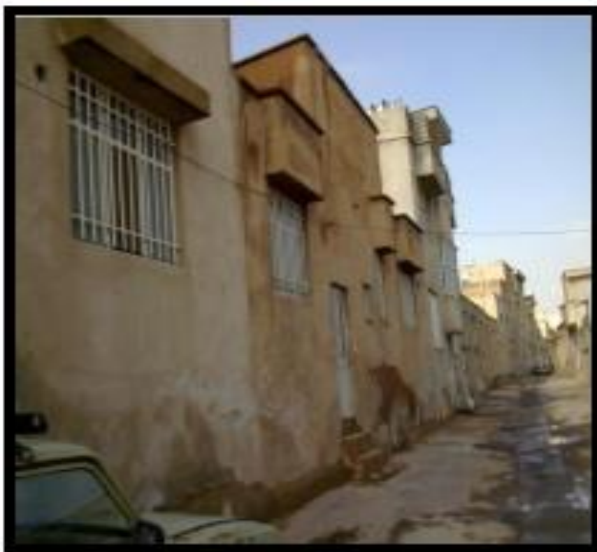
شکل ۱- بافت فرسوده شیراز (نادر کاظمی)

(نادر کاظمی) ۱۱۴۹۳۹ مترمربع وسعت دارد و شامل ۲۳۰۲ نفر می باشد. بررسی وضعیت قطعات کاربری ها (جدول ۲) نشان می دهد که ۴۹۲ قطعه در این محدوده موجود است که ۳۹۷ قطعه به کاربری مسکونی، ۷۵ قطعه به کاربری تجاری و ۹ قطعه به زمین بایر و مابقی به سایر خدمات اختصاص دارد.