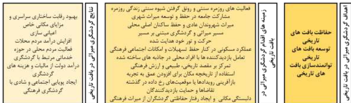
جدول ۱- دسته بندی مبانی نظری اقدامات گردشگری میراثی در بازآفرینی بافت تاریخی (منبع: مطالعات نگارندگان، ۱۴۰۲)

تحقیقات (Megeirhi et al., 2020) نشان داده است که تقاضای بازدیدکنندگان جز مهمی است که باید در برنامه‌ریزی گردشگری پایدار در نظر گرفته شود و برای اینکه گردشگری پایدار در نظر گرفته شود، نیاز به حمایت بازدیدکنندگان دارد تا حد امکان موفق باشد. فرآیند شکل‌گیری مسیرهای فرهنگی به عنوان محصولات گردشگری به عنوان یک اصل جدید حفاظت از میراث فرهنگی، تجدید حیات، بهره برداری و نمایش در نظر گرفته می‌شود (Bjeljac et al., 2015). دل‌بستگی مکانی ایجاد شده توسط گردشگران در فرآیند گردشگری در سایت‌های میراث فرهنگی می‌تواند سلامت روانی گردشگران را ارتقا داده و رفتار حفاظتی گردشگران از میراث فرهنگی را تحریک کند (Zhang et al., 2023). بر اساس تحقیقات (Sanagustin – Fons et al., 2020) گردشگری فرهنگی شادی را ترویج می‌کند و پویایی اجتماعی ایجاد شده در تجربیات گردشگری فرهنگی برای مردم اهمیت زیادی دارد.