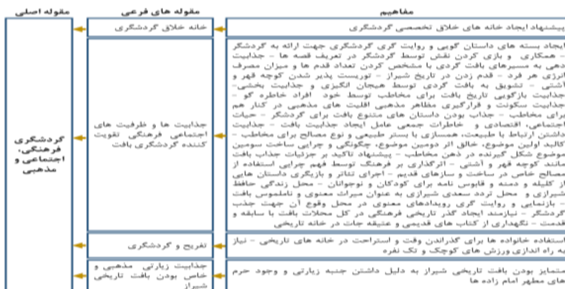
جدول ۳- شرایط علی خوانش گردشگری میراثی (منبع: یافته‌های پژوهش، ۱۴۰۲)