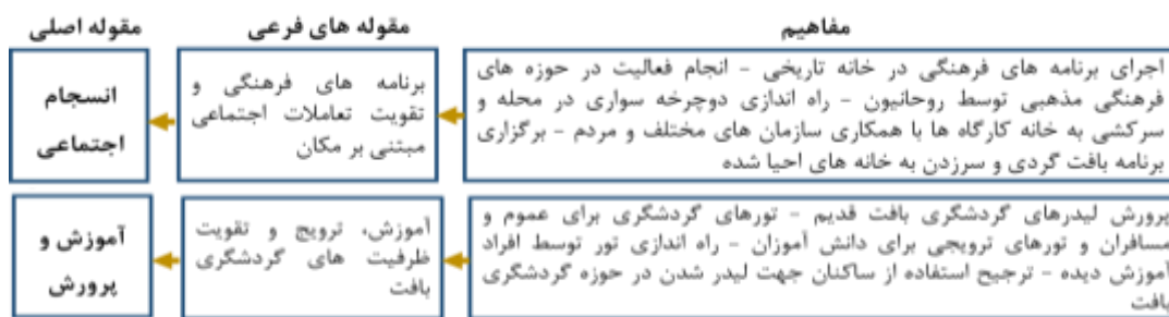
جدول ۲- شرایط علی خوانش گردشگری میراثی

بر اساس رهیافت استراوس و کوربین در نظریه داده بنیاد عوامل علی آن دسته از مفاهیمی است که به طور کلی و در قالب مجموعه‌ای از کدهای شناسایی شده بر راهبردها، عوامل زمینه‌ای، عوامل مداخله‌ای و پیامدها تأثیر دارند. عوامل موثر بر گردشگری میراثی در الگوی بازآفرینی بافت‌های تاریخی از بررسی اسناد و دیدگاه مصاحبه شونده‌گان و همچنین نتایج حاصل از مقوله بندی کدها ارائه گردیده است.