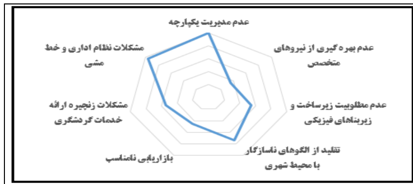
شکل ۳- نمودار میزان اهمیت هر یک از موانع سیاست‌گذاری گردشگری در محیط‌های شهری