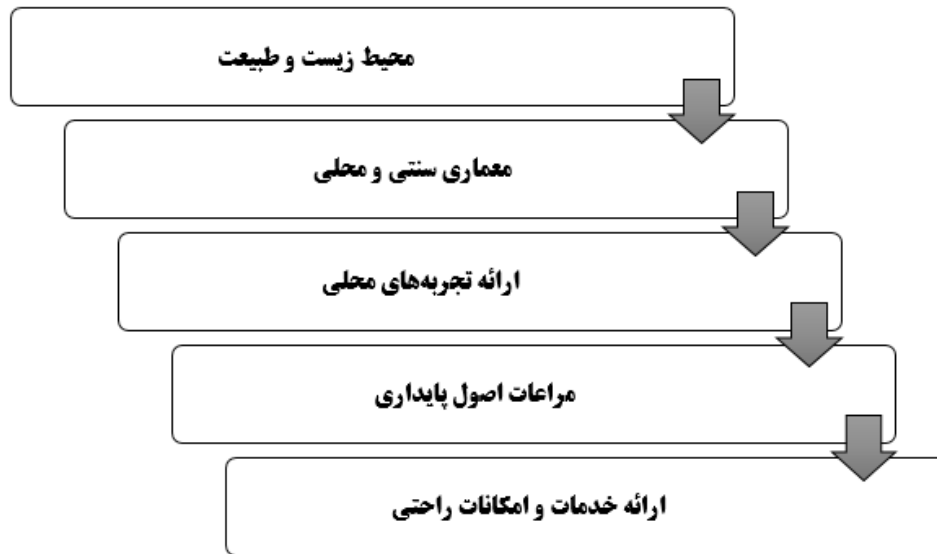
شکل ۱. اجزای اصلی یک اقامتگاه بوم‌گردی (چان و همکاران: ۲۰۲۲، ۱۶۵-۱۴۷)

به طور کلی، اقامتگاه‌های بوم‌گردی باید توانایی ایجاد تجربه‌های گردشگری یکتا و ممتاز را داشته باشند و همچنین به محیط زیست و جامعه محلی احترام بگذارند.