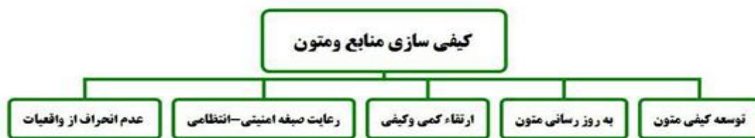
شکل ۲. شاخص‌های کیفی سازی منابع و متون برنامه درسی آموزش شایسته محور پلیس