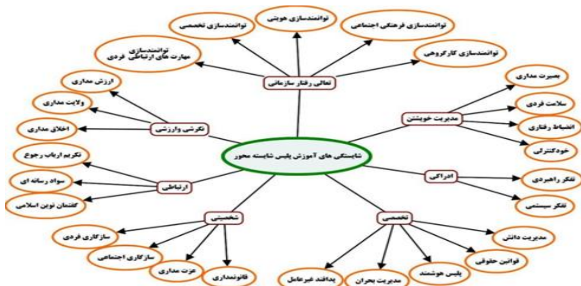
شکل ۱ ابعاد و مؤلفه‌های برنامه درسی آموزش شایسته محور پلیس

(Amery,2017)، جزینی (Jazini,2014) همخوانی دارد. در بعد شایستگی‌های شخصی که ۴ مؤلفه سازگاری اجتماعی، سازگاری فردی، عزت‌مداری، قانون‌مداری داشت در مؤلفه سازگاری اجتماعی در شاخص سازگاری با ارزش‌های و هنجارهای سازمانی، سازگاری اجتماعی، تحمل شنیدن صدای مخالف، رعایت حقوق و آزادی‌های فردی با یافته‌های امیرنژاد و رشیدی ( Amirnejad & Rashidirad, 2017)، محبی و محمدیان ( Mohebi & Mohamadyan,2017) علیزاده (Alizadeh,2018) همخوان بود. در بعد شایستگی‌های شخصی که ۴ مؤلفه سازگاری اجتماعی، سازگاری فردی، عزت‌مداری، قانون‌مندی، داشت در مؤلفه سازگاری اجتماعی، شاخص سازگاری با ارزش‌ها و هنجارها، رعایت حقوق و آزادی‌های فردی، با یافته‌های محمدی و همکاران (Mohamadi et al, 2016)، علیزاده (Alizadeh,2018)، محبی و محمدیان ( Mohebi & Mohamadyan, 2017)، امیرنژاد و رشیدی ( Amirnejad & Rashidirad, 2017)، (olson & Bolton,2000) همخوانی دارد و در مؤلفه عزت‌مداری در شاخص عطف و کمک به مردم، عزیز بودن در چشم مردم، ترحم نسبت به مردم با یافته‌های ( Uspanov, Turabayeva &