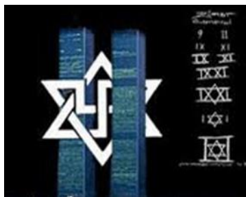
شکل ۴- نماد آژانس امنیت اسرائیل (شین بت)

آژانس امنیت اسرائیل (شاباک یا شین بت) (در عبری: שב"ט)، نام سازمان اطلاعات و امنیت داخلی در کشور اسرائیل است که مسئولیت جمع‌آوری اطلاعات مربوط به داخل مرزهای اسرائیل و مناطق خودمختار فلسطینی و همچنین خنثی‌سازی فعالیت‌های تروریستی را برعهده دارد.