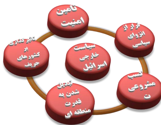
شکل ۳- مدل مفهومی ۳، سیاست خارجی اسرائیل