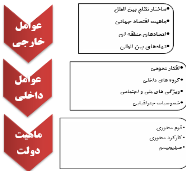
شکل ۲- مدل مفهومی ۲، ملاحظات سیاست خارجی اسرائیل

توجه به عناصر ماهیتی دولت اسرائیل از یک سو و توجه به ماهیت دولت در روابط بین الملل و پرداختن به دولت، ماهیت و ذات آن از سوی دیگر مبنای نظری اهمیت ماهیت دولت اسرائیل در شکل گیری سیاست خارجی این کشور را تشکیل می‌دهد. به عبارت دیگر، مطالعه ویژگی‌ها و خصوصیات ذاتی دولت اسرائیل که برخاسته از عوامل متعددی بوده است، می‌تواند مطالعه سیاست خارجی اسرائیل را که به رغم اکثر تحلیل‌گران استثنایی است، با جامعیت همراه سازد. از سوی دیگر، توجه به ماهیت دولت در مطالعات روابط بین الملل و سیاست خارجی می‌تواند به ظهور تحلیل‌های جدید در خصوص سیاست خارجی اسرائیل بینجامد. بنابراین، مدل ارائه شده جهت مطالعه سیاست خارجی اسرائیل و بررسی عوامل مؤثر در شکل گیری آن، با عوامل داخلی و بین المللی تکامل یافته است. ویژگی اصلی مدل ارائه شده، صرف نظر از پرداختن به تک تک عوامل مؤثر در شکل دهی سیاست خارجی اسرائیل، اهمیت دادن به عامل ماهیت دولت است که با الهام از نوشته‌های مایکل برچر و عبدالوهاب المسیری استنباط گردیده است. توجه به ماهیت دولت در بخش حاضر از ویژگی‌های بدیع، به شمار می‌رود زیرا در ادبیات سیاست خارجی اسرائیل به ندرت مورد توجه واقع شده است. بنابراین، مدل تحلیلی پیشنهادی جهت مطالعه سیاست خارجی اسرائیل به شرح زیر می‌باشد در واقع این عوامل ملاحظات اسرائیل در تبیین و تعیین سیاست خارجی است.