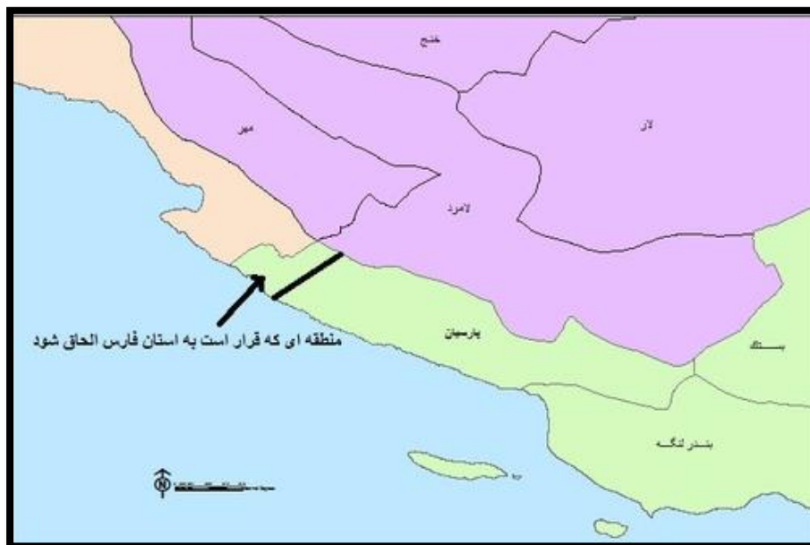
شکل شماره ۳: نقشه محدوده انتزاعی از شهرستان انتزاعی استان هرمزگان و الحاق آن به لامرد فارس

پس از انقلاب برای اولین بار در اوایل دهه هفتاد در دوران ریاست جمهوری هاشمی رفسنجانی، طرح اتصال استان فارس به دریا مطرح شد که با واکنش نمایندگان هرمزگان متوقف شد. سپس در دوران ریاست جمهوری خاتمی این طرح با پیشنهاد دسترسی استان فارس به دریا از طریق عسلویه استان بوشهر ناکام ماند. در اواخر دوره دوم دولت احمدی‌نژاد مصوبه الحاق بخشی از استان هرمزگان به فارس به تصویب رسید. در نهایت با روی کار آمدن دولت یازدهم در نهایت وزیر کشور در شهریور ۱۳۹۲ در نامه‌ای ابلاغ مصوبه الحاق بخشی از استان هرمزگان به استان فارس که در دولت دهم تصویب شده بود را بلامانع خواند تا بدین ترتیب مصوبه الحاق استان فارس به خلیج فارس از طریق انتزاع تعدادی از روستاهای شهرستان پارسیان استان هرمزگان و الحاق آن به شهرستان لامرد استان فارس نهایی شود. بدین ترتیب وزیر کشور با الحاق پنج روستای بخش کوشکنار تابع شهرستان پارسیان در استان هرمزگان به این استان و همجواری ۶ کیلومتر آن با ساحل به خلیج فارس موافقت کرد. بر مبنای این طرح پنج روستای صورباش، فارسی، اکبری، تمبو جنوبی و تمبو شمالی از بخش کوشکنار تابع شهرستان پارسیان در استان هرمزگان جدا شده و به دهستان حومه (ترمان) از بخش مرکزی شهرستان لامرد استان فارس ملحق می‌شود.