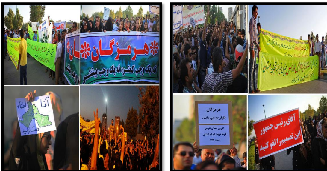
شکل شماره ۴: تصویر تجمع و اعتراض مردم هرمزگان نسبت به جدایی بخش‌هایی از این استان

مجلس شورای اسلامی تهدید کردند در صورت باقی ماندن این مصوبه به طور دسته‌جمعی استعفا خواهند داد (خبرگزاری مهر، ۱۳۹۲/۷/۲۹). جناح‌ها و گروه‌های سیاسی هرمزگان با اعلام موضعی هماهنگ با این طرح مخالفت کردند (پایگاه خبری جنوب ایران، ۱۳۹۲/۷/۱۸). همگام با اعتراضات مسئولان سیاسی و فعالان مدنی استان، هزاران نفر از مردم بندرعباس مرکز استان هرمزگان به صورت خودجوش سلسله اعتراضاتی را طی روزهای متوالی در مهرماه سال ۱۳۹۲ برگزار کردند و خواستار لغو این مصوبه شدند. این اعتراضات در برخی مناطق به خشونت نیز کشیده شد.