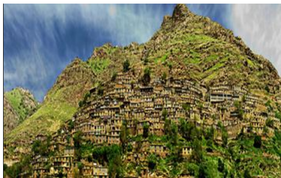
شکل ۴. چشم‌اندازی از روستای اورامان تخت

فضای زندگی ساکنان روستا با محیط طبیعی آن و همچنین نحوه معیشت و فعالیت‌های اقتصادی آنان آمیخته است به طوری که درخانه‌ها علاوه بر محل استراحت، اتاق‌ها، سرویس‌های بهداشتی و آشپزخانه عموماً طویله، انبار غله، انبار علوفه و حتی مکانی برای قرار دادن دارهای عمودی قالی و دستگاه‌های گلیم و جاجیم بافی تعبیه شده است. دیوار خانه‌های روستا به صورت خشک چینی ساخته شده است. این دیوارها بدون استفاده از ملاط و به طور هنرمندانه چیده شده‌اند. مهمترین مصالح به کار رفته در بنای خانه‌ها سنگ و چوب است. اورامان تخت با باغات سرسبز و زیبایی و همچنین موقعیت خاص طبیعی و اقلیمی که دارد یکی از خیال‌انگیزترین و پرجاذبه‌ترین روستاهای استان کردستان می‌باشد. رودخانه پرآب و خروشان سیروان از دره‌های عمیق این ناحیه می‌گذرد و پس از طی مسافتی وارد خاک عراق می‌شود. کرانه‌های رودخانه سیروان را رود بار می‌گویند.