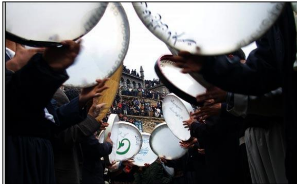
شکل ۳. نمایی از مراسم پیر شالیار در روستای اورامان تخت

باستان) این سرزمین در گذشته قلمرو فرمانروایان و سلاطین محلی بوده که با اقتدار بر آن حکم فرمایی می‌کردند به همین دلیل این روستا را «تخت» یعنی پایتخت یا مرکز سلطنت نامیده‌اند. مقبره پیر شالیار که یکی از عرفای این سرزمین است در این روستا قرار دارد. در روایات است که گویند پیر شالیار یکی از روحانیون بزرگ زرتشتی بوده است که گویا بعدها به دین اسلام گرویده، هر ساله در نیمه بهمن مراسمی به نام «پیر شالیار» در جوار مقبره وی برگزار می‌کند که همراه با مراسمی خاص می‌باشد.