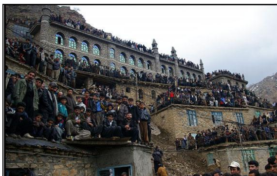
شکل ۵. تجمع گردشگران جهت برگزاری مراسم در روستای اورامان تخت

فضای زندگی ساکنان روستا با محیط طبیعی آن و همچنین نحوه معیشت و فعالیت‌های اقتصادی آنان آمیخته است به طوری که درخانه‌ها علاوه بر محل استراحت، اتاق‌ها، سرویس‌های بهداشتی و آشپزخانه عموماً طویله، انبار غله، انبار علوفه و حتی مکانی برای قرار دادن دارهای عمودی قالی و دستگاه‌های گلیم و جاجیم بافی تعبیه شده است. دیوار خانه‌های روستا به صورت خشک چینی ساخته شده است. این دیوارها بدون استفاده از ملاط و به طور هنرمندانه چیده شده‌اند. مهمترین مصالح به کار رفته در بنای خانه‌ها سنگ و چوب است. اورامان تخت با باغات سرسبز و زیبایی و همچنین موقعیت خاص طبیعی و اقلیمی که دارد یکی از خیال‌انگیزترین و پرجاذبه‌ترین روستاهای استان کردستان می‌باشد. رودخانه پرآب و خروشان سیروان از دره‌های عمیق این ناحیه می‌گذرد و پس از طی مسافتی وارد خاک عراق می‌شود. کرانه‌های رودخانه سیروان را رود بار می‌گویند.